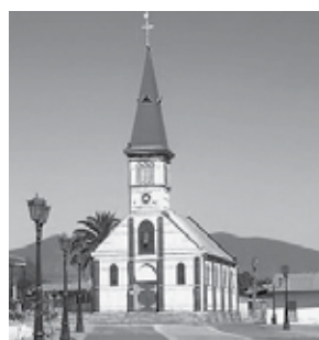
Iglesia Guayacán, Coquimbo, Chile