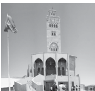
Mezquita, Coquimbo, Chile

Los alumnos observan distintas imágenes de construcciones que tienen fines comunes, pero que reflejan la diversidad cultural de Chile. Guiados por el docente, comentan las imágenes y concluyen que la diversidad de costumbres, celebraciones, construcciones, etc., tiene relación con el aporte de diversas culturas a nuestra identidad. A modo de ejemplo, se proponen imágenes de construcciones de la ciudad de Coquimbo, que reflejan la diversidad religiosa.