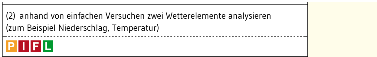
Darstellung der Verweise in der Webansicht (Beispiel aus Geographie 3.1.2.1 „Grundlagen von Wetter und Klima“)

Verweise auf Teilkompetenzen werden unterhalb der jeweiligen Teilkompetenz als anklickbare Symbole dargestellt. Nach einem Mausklick auf das jeweilige Symbol werden die Verweise im Browser detaillierter dargestellt (dies wird in der Abbildung nicht veranschaulicht):