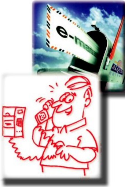
(ز) إعداد قيادات جديدة :

يتطور المجتمع بتجديد قياداته المؤهلة ليواصل المجتمع تقدمه . ونحن نقصد بالقائد ذلك الإنسان الذى يضع خطط صحيحة، وينفذها بآليات صحيحة، وتثق فيه الناس وتسعى إليه كلما واجهتها مشكلة، والقائد من خلال المسؤولية يطور معرفته فتزداد قدرته على التنبه مبكراً إلى المشاكل قبل أن تستفحل ويكون أول من يطرح حلولاً، وتكوين القيادات الجديدة بهذا المفهوم يبدأ داخل مؤسسات المجتمع المدني فى النقابات المهنية والعمالية والجمعيات الأهلية والمنظمات الشبابية والنسائية . . إلخ. حيث تعتبر مؤسسات المجتمع المدني فى الحقيقة المخزن الذى لا ينضب للقيادات الجديدة، ومصدرًا متجددًا لإمداد المجتمع بها .