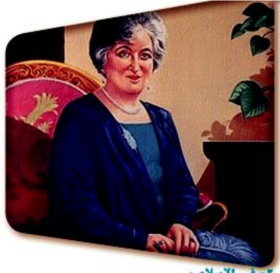
٢- في الإسلام :

العربية ، وكان دورها مؤثرا في توصيل الرسائل بين الثوار ، وهناك علامة مضيئة في تاريخ مصر أبرزتها السيدة « صفية زغلول » من خلال قيادتها حركة سياسية مصرية ، وتكوين أول جماعات نسائية تدافع وتطالب بمشاركة المرأة في الحياة السياسية مثل « حزب نساء مصر » اعتصمت مجموعة من سيدات الحزب في مبني نقابة الصحفيين مطالبين بحقوق المرأة السياسية الكاملة .