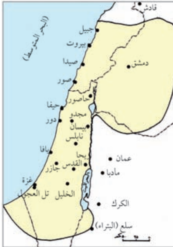
بعض المدن والقرى الكنعانية في فلسطين

«عاش السكان في فلسطين منذ آلاف السنين بعضهم اتخذ من الجبال مسكناً، وبعضهم سكن السهول والوديان، وقد عاشوا في بادية الأمر في تجمعات سكانية، فنوا المدن، وكانت كل واحدة من هذه المدن مستقلة عن الأخرى، ومن هذه المدن: ييوس (القدس)، وشكيم (نابلس)، وبيت شان (بيسان)، ومجدو (تل المتسلم)، وبيت إيل (بيتين)، وجازر (أبو شوشة)، ويريحو (أريحا)». «المؤلفون»