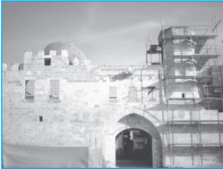
قلعة خان يونس

أعاد بناء هذا السوق الأمير سيف الدين تنكز والي الشام زمن السلطان الناصر بن قلاوون سنة ٧٣٧هـ/ ١٣٣٦م . وهو مجمع تجاري يقع في الجهة الغربية لمنطقة الحرم القدسي الشريف طوله خمسة وتسعون متراً ، يبدأ من باب القطانين أحد أبواب الحرم الشريف من الجهة الغربية ، ويتصل بشارع الواد ، وهو عبارة عن مجموعة من الدكاكين خصصت لبيع الأقمشة بأنواعها المختلفة ، ويضم السوق خمسين دكاناً متقابلة يفصل بينها شارع يبلغ عرضه عشرة أمتار . والدكاكين متشابهة شكلاً وحجماً ، وفي السقف فتحات لإدخال الضوء والهواء إلى الشارع والدكاكين . وقد تم إعادة تعميم هذا السوق عام ١٩٧٤م من قبل دائرة الأوقاف في القدس ، فعادت إليه الحياة من جديد .