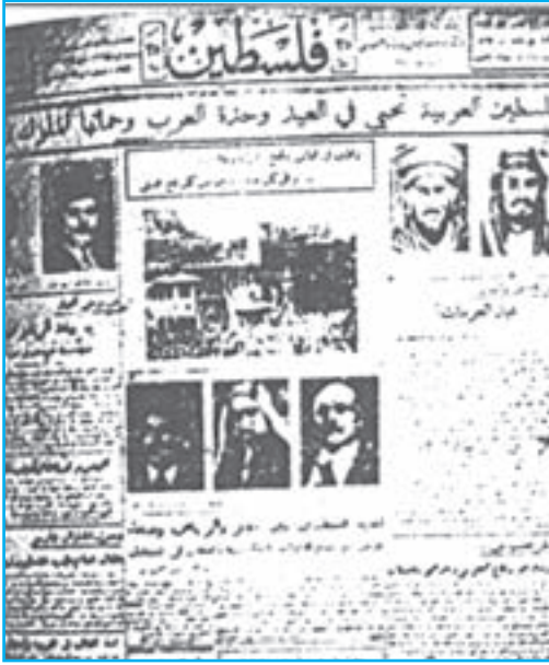
( صحيفة فلسطين )