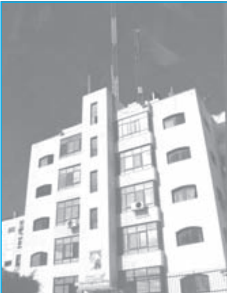
( مبنى هيئة الإذاعة والتلفزيون )

تأسست عام ١٩٣٦م وتولى الشاعر إبراهيم طوقان الاشراف