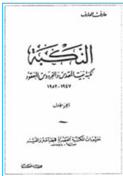
(من مؤلفات عارف العارف)

لقد أسهمت كثير من الشخصيات الفلسطينية في العديد من الدراسات الاقتصادية، والإدارية، والتربوية، والعلمية، وصولاً إلى المفكرين الفلسطينيين المشهورين عالمياً، أمثال إدوارد سعيد، وإبراهيم أبو لغد، وهشام شرابي، وغيرهم.