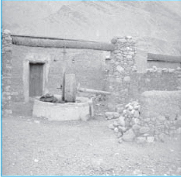
(معصرة زيتون-حجر البدّ)

كانت المعصرة تتكون من قاعدة حجرية دائرية يوضع عليها ثمار الزيتون، وحجر دائري على شكل عجل موضوع على القاعدة، حيث كان يدور باستخدام الخيل أو الحمير لطحن ثمار الزيتون، وتعرف هذه المعاصر بحجر البدّ.