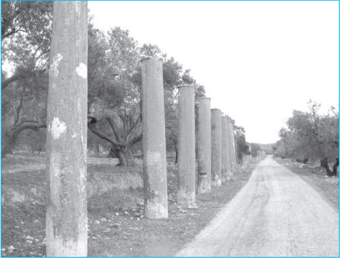
شارع الأعمدة «سبسية»