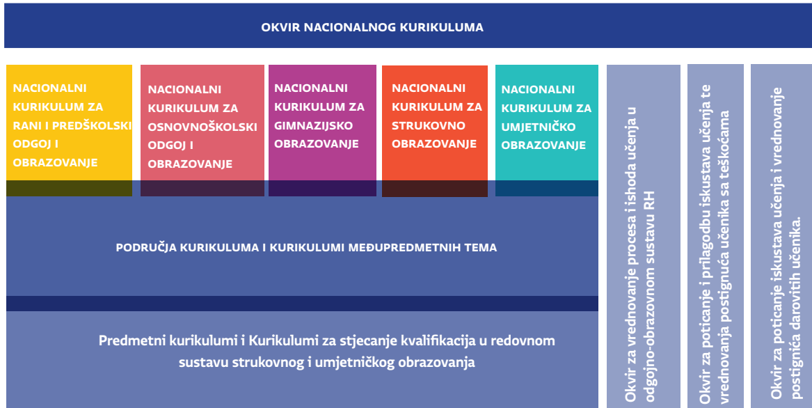
Slika A. Sustav nacionalnih kurikulumskih dokumenata izrađenih u okviru Cjelovite kurikularne reforme

Pred Vama se nalazi prijedlog nacionalnog kurikulumu međupredmetne teme Građanski odgoj i obrazovanje . Okvir nacionalnog kurikulumu (ONK) određuje sustav nacionalnih kurikulumskih dokumenata , kojima se na nacionalnoj razini iskazuju namjere povezane sa svrhom, ciljevima, očekivanjima, ishodima, iskustvima djece i mladih osoba, s organizacijom odgojno-obrazovnoga procesa i s vrednovanjem. Međupredmetne teme izrazito su važan dio odgoja i obrazovanja u Republici Hrvatskoj. Sustav nacionalnih kurikulumskih dokumenata prikazan je na Slici A.