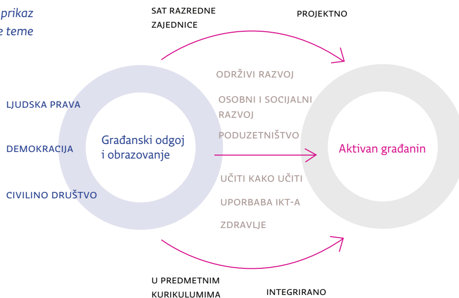
Grafički prikaz međupredmetne teme

Sadržaji domene civilno društvo učenika usmjeravaju na aktivno djelovanje u zajednici. Društvenom participacijom učenik stječe znanja, razvija vještine i oblikuje stavove o važnosti usklađivanja osobnih i zajedničkih interesa u zajednici i sudjelovanju svih građana u doprinošenju zajedničkomu dobru. Da bi uopće došlo do participacije, neophodno je da građani raspoložu bitnim informacijama o radu zajednice i civilnoga društva. Stoga su mediji važni u komunikacijskim procesima. Upoznajući sudjelovanje u civilnome društvu, učenik reagira na društvenu isključenost. Priprema se za uspješno djelovanje, za uočavanje problema u zajednici, istraživanje, predlaganje rješenja i uključivanje u različite aktivnosti. Zalaganjem u okviru civilnoga društva, sudjelovanjem u radu udruga i nevladinih organizacija promiče zajednički interes koji je u početku usmjeren na interes razreda, škole ili lokalne zajednice, a kasnije prerasta u građansku inicijativu u kojoj građani javno djeluju i zalažu se za promicanje vlastitih ideja za dobrobit društva.