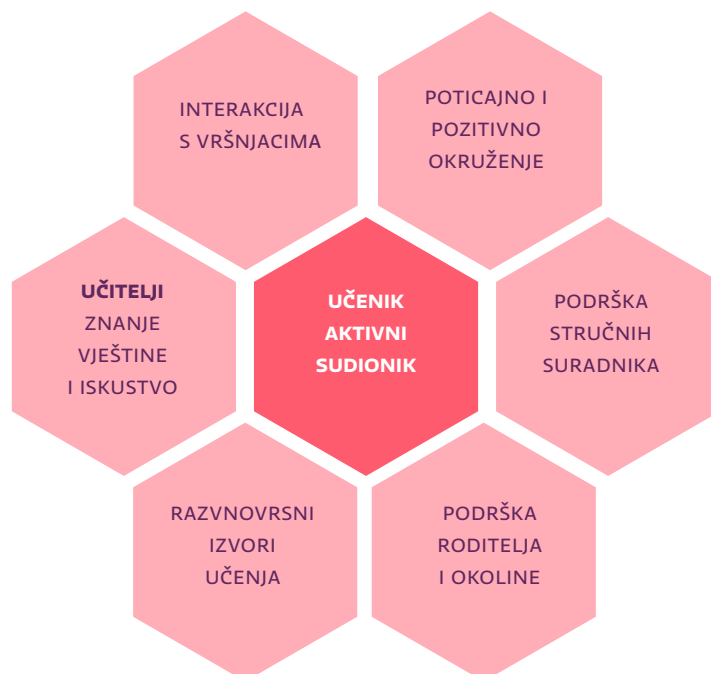
Slika 2. Ključne odrednice odgojno-obrazovnog procesa

Osnovu učenja čini proces kojim učenik aktivno konstruira i nadograđuje svoja znanja i vještine, ali i oblikuje vrijednosti. U procesu poučavanja učenicima se aktivnim sudjelovanjem u učenju i preuzimanjem odgovornosti za proces učenja omogućava razvoj kompetencija, razvoj strategija učenja i osobni razvoj.