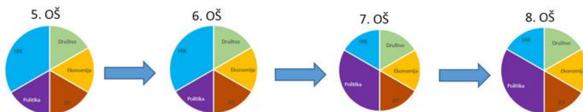
Slika 2: Struktura učenja predmeta Povijesti u osnovnoj školi prema domenama

Sadržaji iz nacionalne, europske i svjetske povijesti poučavaju se kronološkim redosljedom: u petome razredu uči se prapovijest i stari vijek, u šestome razredu srednji i rani novi vijek, u sedmome razredu razdoblje od početka 18. stoljeća do kraja Prvoga svjetskog rata i u osmome razredu razdoblje nakon 1918. godine. U svakoj godini učenja Povijesti u osnovnoj školi predviđeno je 16 obveznih tema s pripadajućim odgojno-obrazovnim ishodima. Uz obvezne teme učitelj mora obraditi još najmanje dvije izborne teme. Izborne teme učitelj može izabrati s popisa preporuka izbornih tema ili sam osmisliti temu prema domenama kurikuluma, ovisno o interesu učenika. U izbornim temama mogu se kombinirati različite domene. Za izborne teme učitelji sami oblikuju odgojno-obrazovne ishode. U izbornim temama potrebno je dodatno staviti naglasak na aktivno učenje, istraživanje, rješavanje problema, konceptualno i proceduralno znanje te razvoj metakognicije. Učenike treba potaknuti da samostalno odaberu način prezentacije svoga rada (razredna izložba, video radovi, izlaganja, eseji, školski projekt i sl.).