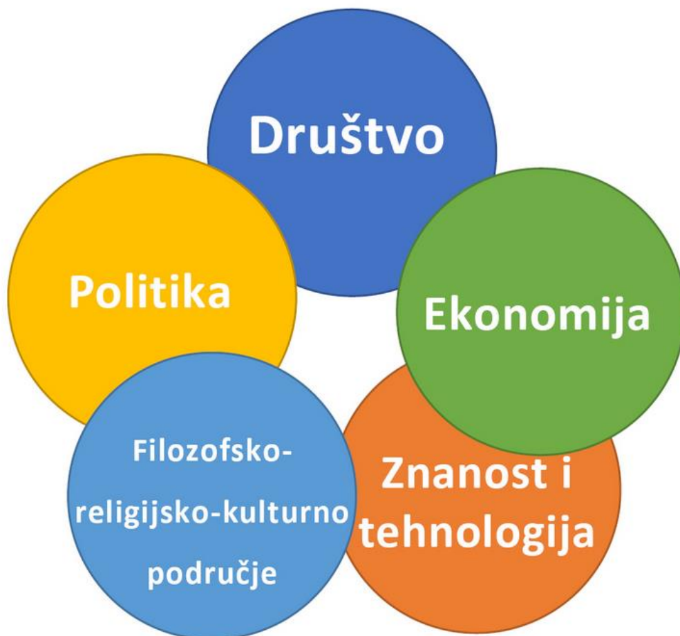
Slika 1. Domene u kurikulumu Povijesti

Predmetni kurikulum Povijesti organiziran je u pet domena: društvo, ekonomija, znanost i tehnologija, politika te filozofsko-religijsko-kulturno područje. Izvorište za ovakav pristup nalazimo u povijesnoj znanosti koja proučava prošlost u sklopu pet različitih područja ljudske djelatnosti, a to su: društveno područje, političko, znanstveno i tehnološko, ekonomsko i kulturno.