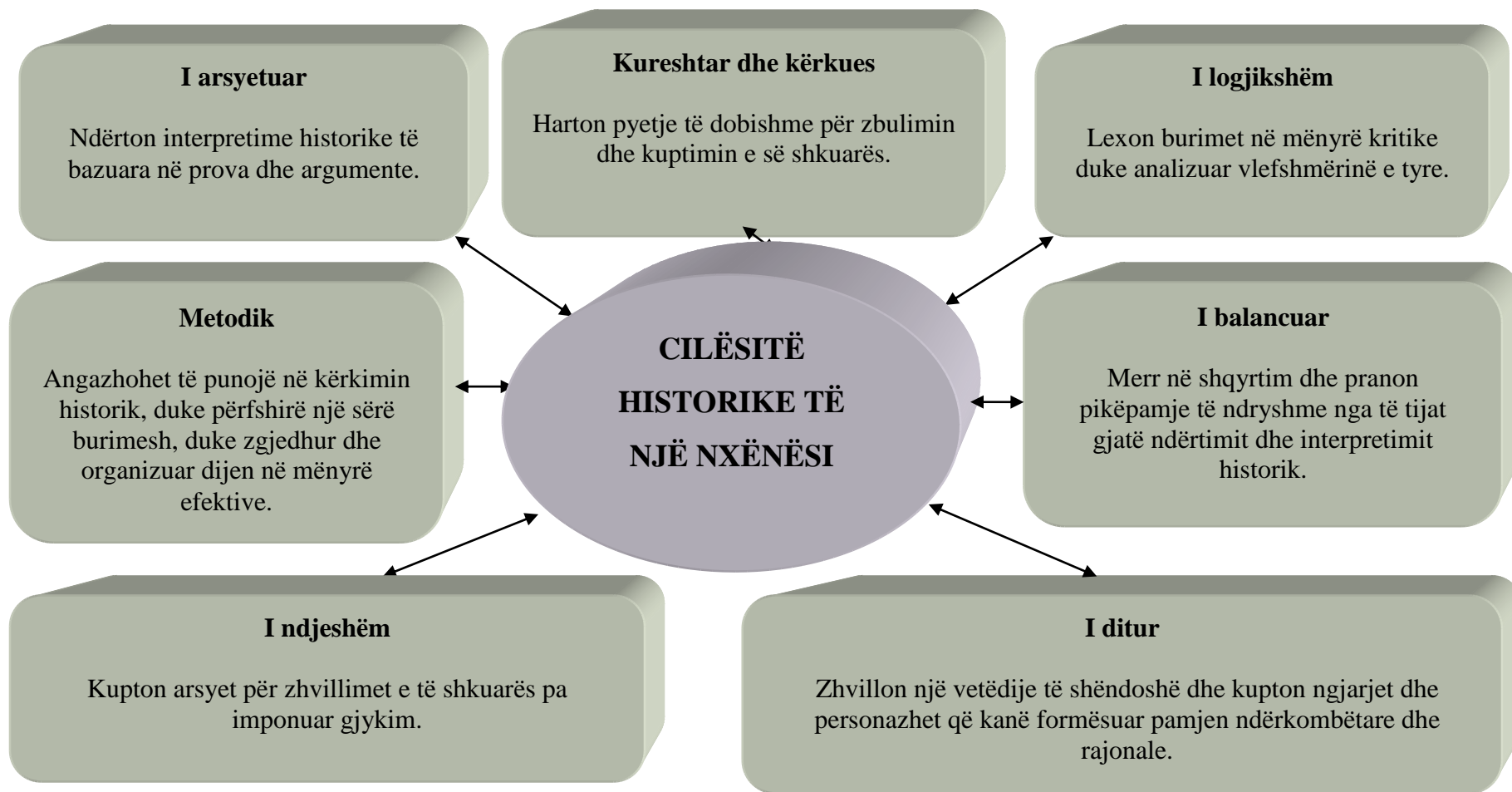
Diagrami 5: Cilësitë historike të nxënësit