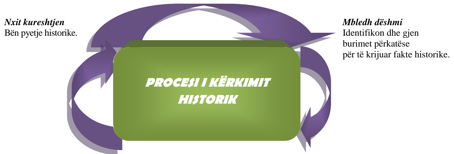
Figura 1: Procesi i kërkimit historik