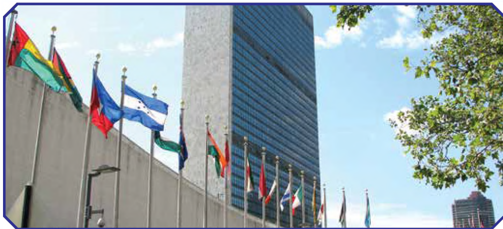
BMT shtab kvartirasi. Nyu-York

Oʻzbekiston BMT aʼziligiga 1992-yil 2-martda qabul qilindi. BMT bosh idorasi Nyu-Yorkda (AQSh) joylashgan.