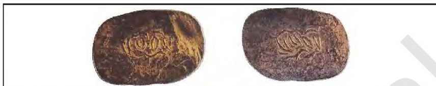
Mis tanga. XVI asr

paytda, dehqonlarning soliq to'lash imkoniyatini oshirishga, davlat mulkini ko'paytirishga xizmat qildi.