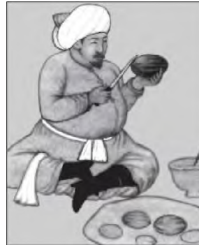
Abdullaxon II (miniatura, 1572)

Muhammad Islom va uning avlodlari o'zlarining kelib chiqishini ota tomonidan Muhammad payg'ambar avlodlariga, ona tomonidan esa Chingizxon va Jo'jiga bog'lar edilar. XVI asrning ikkinchi yarmida Mu-