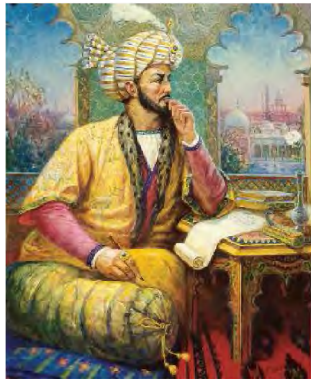
Zahiriddin Muhammad Bobur