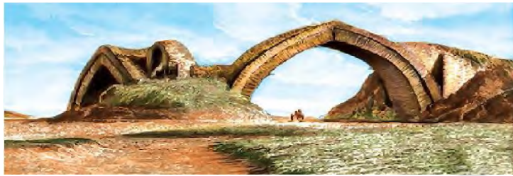
Zarafshon daryosida qurilgan ko'prik – suv ayirg'ich