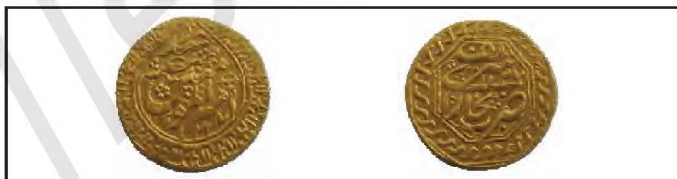
1809-yilda zarb etilgan oltin tanga (Xiva)

Soliq tizimida o'tkazilgan islohotga ko'ra, soliqlarning muntazam undirilishi ta'minlandi. Bunga yerdan olinadigan soliqning mahalliy hokimlar tomonidan yig'ilishiga chek qo'yish, soliqlarning xon tomonidan tayinlangan davlat amaldorlari tomonidan yig'ilishi tartibining o'rnatilishi orqali erishildi. Ayni paytda, yer solig'ining ancha qismi pul shaklida yig'iladigan va ularning hammasi umumdavlat xazinasiga topshiriladigan bo'ldi. Shuningdek, bojxona xizmatining tashkil etilganligi va oltin tangalar zarb etilib muomalaga chiqarilganligi davlat xazinasiga tushumning ko'payishiga xizmat qildi. Muhammad Rahimxon I mamlakatda ichkilikni taqiqladi.