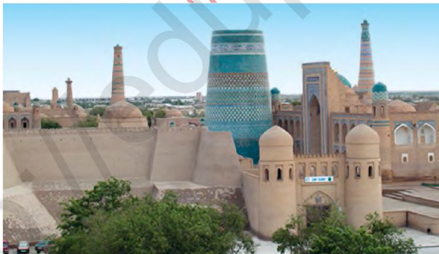
Xiva. Ichan qal'a

Ichan qal'a Ichan qal'a bobolarimizdan qolgan O'rta Osiyodagi yirik va noyob me'moriy yodgorlikdir. Ichan qal'a Xiva shahrining ichki qal'a (Shahriston) qismidir. Ichan qal'a Dishan qal'adan devor bilan ajralib turadi. Unga Bog'cha, Polvon, Tosh va Ota deb nomlangan to'rtta darvoza orqali kirilgan. Xorazm o'lkasi me'morchiligining ajoyib obidalarini – madrasa, masjid, xon saroyi, ma'muriy binolar, bosh maydon va minoralar Ichan qal'ada joylashgan. Muhammad Rahimxon, Olloqulixon va Muhammad Aminxon hukmronliklari davrida Ichan qal'ada keng ko'lamli bunyodkorlik ishlari amalga oshirildi. Muhtasham saroy, madrasa va maqbaralar barpo etildi. Ko'hna arkdagi saroy qurilishi tugallandi. Muhammad Aminxon Ichan qal'aning g'arbiy qismidagi Ko'hna ark yoniga Kalta minor nomi bilan mashhur bo'lgan minorani qurdirdi.