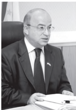
Раиси Маҷлиси намоёндагони Маҷлиси Олии Ҷумҳурии Тоҷикистон Шукурҷон Зухуров

Маҷлиси намоёндагон аз 9 кумита – оид ба иқтисод, буҷет, молия ва андоз; оид ба қонуниятҳои конститутсионӣ, қонунгузорӣ ва ҳуқуқи инсон; оид ба сохтори давлатӣ ва шугли аҳоли; оид ба қорҳои байналмилалӣ, иттиҳодияҳои ҷамъиятӣ ва иттилоот; оид ба илм, маориф, фарҳанг ва сиёсати байни ҷавонон; оид ба масъалаҳои иҷтимоӣ, оила, ҳифзи сиҳатӣ ва экология; оид ба тартиботи ҳуқуқӣ, муҳофизат ва амният; оид ба энергетика, саноат, сохтмон ва коммуникатсия, инчунин, аз ду комиссия – оид ба назорати дастур ва ташкили қор, оид ба одоби вақилон иборат мебошад.