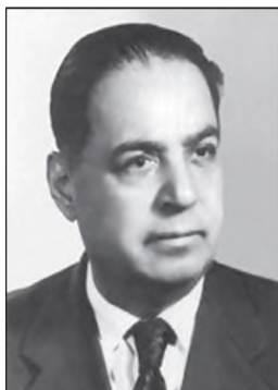
Қаҳрамони Тоҷикистон, академик Бобочон Ғафуров

Бо Фармони Президенти Ҷумҳурии Тоҷикистон Эмомалӣ Раҳмон 8-уми сентябри соли 1997 барои хизматҳои бузург ва фидокориҳо дар поягузори Истиқлолияти Тоҷикистон, руши тамаддун ва худшиносии миллӣ ба фарзанди бошарафи халқи тоҷик Бобочон Ғафуров унвони олии «Қаҳрамони Тоҷикистон» дода шуд.