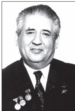
Қаҳрамони Тоҷикистон, академик, Шоир халқии Тоҷикистон Мирзо Турсунзода

Дар Фармони Президенти Ҷумҳурии Тоҷикистон Эмомалӣ Раҳмон аз 7 майи соли 2001 омадааст: «Барои хизматҳои бузург ва матонат дар бунёди пояҳои Истиқлолияти Ҷумҳурии Тоҷикистон, инкишофи адабиёт, фарҳанг ва тарғиби гояҳои сулҳ, дӯстии халқҳо ва густариши нуфузи байналмилалӣ Тоҷикистон ба фарзанди шарафманди халқи тоҷик Мирзо Турсунзода унвони «Қаҳрамони Тоҷикистон» дода шавад».