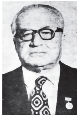
Аввалин ректори Донишгоҳи миллии Тоҷикистон, академик З.Ш. Раҷабов

Шоирону нависандагони тоҷик эҷодиёти худро ба ҷалб намудани шаҳрвандон ба қорҳои барқароркунӣ, мустаҳкам намудани дӯстии халқҳо, тарбияи насли наврас ва ба ҳаёту фаъолияти зани тоҷик бахшида буданд.