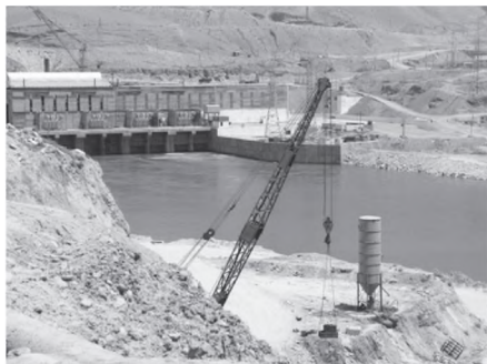
Сохтмони Неругоҳи барқи оби Розун

муда, соли 1991 ба миқдори 67,9 миллион доллар ва соли 2004-ум ба 914,9 миллион доллар расонд. Хусусан, гурӯҳҳои зерини молҳо: маҳсулоти рустани, маъданӣ, бофандагӣ ва маснуоти бофандагӣ, металлҳои арзонбаҳо бештар бароварда шуданд.