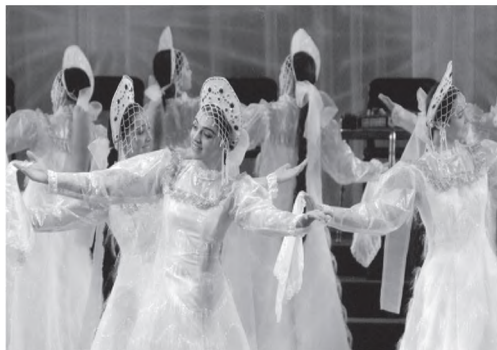
Рӯзи Тоҷикистон дар ЮНЕСКО, Париж, октябри соли 2005. «Ансамбли «Зебо»

Дар ибтидои асри XXI ин робитаҳо бо мамлакатҳои дуру наздики ҷаҳон дар самтҳои тайёр кардани мутахассисони баландихтисос аз байни ҷавонон; гузаронидани рӯзҳо ва ҳафтаҳои фарҳангу санъат; иштирок дар спартакиадаҳо, олимпиада ва ҳар гуна мусобиқаҳои варзишӣ байни давлатҳо; ширкат дар конференсҳо, симпозиумҳои байналмилалӣ ва ғайра амали гардонда шуданд. Масалан, ба варзишгарони Ҷумҳурии Тоҷикистон танҳо дар давраи соҳибистиклолӣ муяссар шуд, ки мустақилона дар ҳаракати варзишӣ ва олимпиадаи давлатҳои мусулмонӣ иштирок намоянд. Моҳи апрели соли 2005 дастаҳои варзишии Тоҷикистон дар олимпиадаи мамлакатҳои мусулмонӣ, ки дар Арабистони Саудӣ барпо гардида буд, иштирок намуда, ба унвон ва тухфаҳо ноил гардиданд.