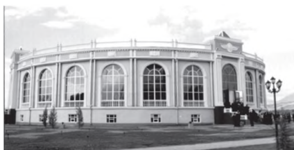
Бинои амфитеатр дар Душанбе

Бо таъкилиҳои Тоҷикистони соҳибистиклол, сарфи назар аз мушкилиҳои давраи гузариш, дар ҷумҳурӣ консепсияи давлатдорӣ оид ба рушди фарҳанг таҳия шудааст. Хусусан, дар суҳанрониҳои ҳарсолаи Пешвои миллат, Президенти Ҷумҳурии Тоҷикистон Эмомалӣ Раҳмон дар назди зиёиёни мамлакат назария ва амалияи фарҳанг ба тариқи мушаххас муайян мегарданд.