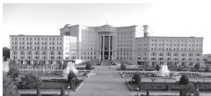
Китобхонаи миллии Тоҷикистон

клубҳо, қасрҳои маданият, осорхонаҳо, боғҳои маданият ва ғайраҳо дар байни шаҳрвандонамон кори пурмазмуни тарбиявӣ мебаранд. Сарфи назар аз мушкилоти иқтисодӣ, дар ҷумҳурӣ 2593 муассисаи фарҳангӣ, аз ҷумла 1395 китобхонаи оммавӣ, 1058 муассисаи клубӣ, 22 осорхона, 40 боғи фарҳангӣ фароғатӣ, 21 театри халқӣ, 57 ансамбли тарона ва рақс дар сатҳҳои гуногун амал мекунанд.