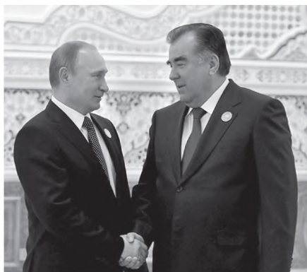
Воҳӯрии Президенти Ҷумҳурии Тоҷикистон Эмомалӣ Раҳмон бо Президенти Федератсияи Русия Владимир Путин

Дар навбати худ Тоҷикистон барои пешрафти саноати металлургияи ранга, кимиё (алюминий, сурб, рух, симоб) ва бофандагии Русия кумаки амалӣ мерасонад. Тоҷикистон аз Русия, барои комплекси агросаноати худ мошинаҳо, трансформаторҳои пуриктидор ва таҷҳизоти технологӣ мегирад.