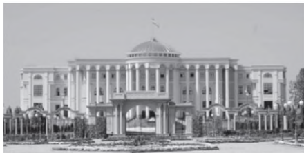
Қасри миллат дар ш. Душанбе

Иттиҳоди Шӯравӣ барҳам хӯрд ва чумхуриҳои он соҳибистиклол гардиданд. Тоҷикистон то ташкил ёбии чумхурии соҳибистиклол дорои заминаи мустақами иқтисодӣ, илмӣ ва фарҳангӣ буд. Вазъи моддӣ ва маънавии шаҳравандон низ хеле хуб буд. Аҳолии чумхурӣ босавод ва дар ҳамаи соҳаҳои илму фарҳанг олимони забардаст, духтурону муҳандисони соҳибтаҷриба дошт. Захираҳои фаровони табиӣ, тараққиёти соҳаҳои гуногуни хоҷагии халқ, аз ҷумла пахтакорӣ, соҳаҳои гуногуни саноат барои боз ҳам бехтар намудани некуаҳолии халқ заминаи хуб ба шумор мерафтанд, вале бо пошхӯрдани ИҚШС робитаҳои иқтисодӣ, фарҳангии байни чумхуриҳо, аз ҷумла Тоҷикистон бо марказ қанда шуда, вазъи иқтисодии мардум яқбора