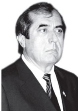
Раиси Маҷлиси миллии Маҷлиси Олии Ҷумҳурии Тоҷикистон Маҳмадсаид Убайдуллоев

раи вазъи ҳуқуқии узви Маҷлиси миллӣ ва вакили Маҷлиси намояндагони Маҷлиси Олии Ҷумҳурии Тоҷикистон», «Дар бораи ворид намудани тағйиру иловаҳо ба Кодекси хоҷагии Ҷумҳурии Тоҷикистон» ва ғайра.