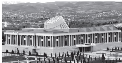
Осорхонаи миллии Тоҷикистон

Дар ҳаёти фарҳангии ҷумҳурӣ мунтазам гузаронидани фестивал озмуни ҷумҳуриявӣ телевизионӣ эҷодиёти халқ – «Андалеб» бахшида ба чашни Истиклолияти давлатии Ҷумҳурии Тоҷикистон низ аз аҳамият ҳолӣ нест. Дар рафти ин фестивал озмун ҳунарҳои мардумӣ намоиш дода шуда, дар он намунаҳои беҳтарини ҳунарҳои халқӣ, аз қабилӣ заргарӣ, оҳангарӣ дуредгарӣ, қулолию чармгарӣ, дӯзандагӣ, чакандӯзӣ, кандакорӣ пешниҳод карда мешаванд. Танҳо дар фестивал-озмуни «Андалеб» бахшида ба чашни 10-солагии Истиклолияти давлатии Тоҷикистон 1200 нафар санъаткори халқӣ, 2110 нафар ҳунарманд аз ҳамаи ноҳия ва шаҳрҳои ҷумҳурӣ иштирок доштанд.