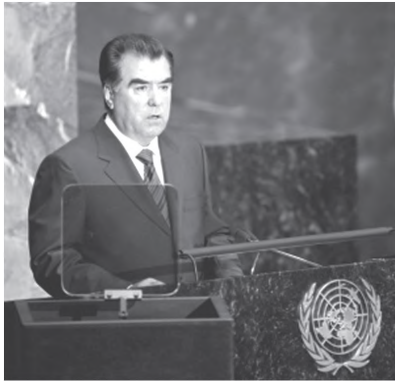
Суҳанрони Президент Ҷумҳурии Тоҷикистон Эмомалӣ Раҳмон аз минбари Созмони Милали Муттаҳид

ба ҳалли проблемаҳои глобалӣ пешниҳод намуд. 14 сентябри соли 2005 дар саммити СММ, ки дар ш. Нью-Йорк барпо гардид, Эмомалӣ Раҳмон, оид дар соли 2010 дар шаҳри Душанбе гузаронидани Форуми байналмилалӣ барои ҳалли масъалаи оби тоза таклифи муфид пешниҳод намуд ва дар хусуси мубориза бар зидди терроризм, экстремизм, нашъачаллобӣ, одамфурӯшӣ ва гуломдории муосир суҳанронӣ кард.