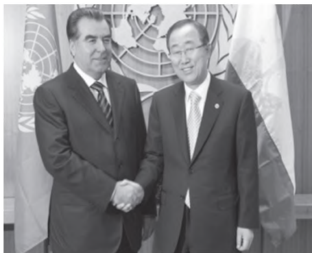
Воҳӯрии Президенти Ҷумҳурии Тоҷикистон Эмомалӣ Раҳмон бо Дабири кулли Созмони Милали Муттаҳид Пан Ги Мун

таҳкими мавқеи давлат дар арсаи байналмилалӣ иборат бошанд.