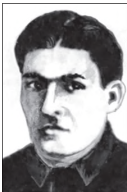
Қаҳрамони Тоҷикистон Шириншоҳ Шоҳтемур

Мутаассифона, душманон муваффақиятҳои халқи тоҷикро дар роҳи эҳё ва таъсиси Ҷумҳурии Шӯравии Сотсиалистии Тоҷикистон, соҳтмони ҷомеаи нав дида натавониста, сарварони давлат, аз ҷумла Нусратулло Махсумро ба ҷазои сиёсӣ гирифткор карданд. Хушбахтона, ҳақиқат ғалаба кард ва номи неки бегуноҳ ҷазодидигон барқарор шуд. Ба туфайли соҳибистиклол гардидани Тоҷикистон Нусратулло Махсум низ ба унвони баланди «Қаҳрамони Тоҷикистон» мушарраф гардид.