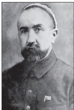
Кахрамони Тоҷикистон Нусратулло Махсум

Соли 2011 шахрвандони Ҷумҳурии Тоҷикистон 100-солагии зодрузи Мирзо Турсунзодаро бо тантанаи бузург чашн гирифтанд.