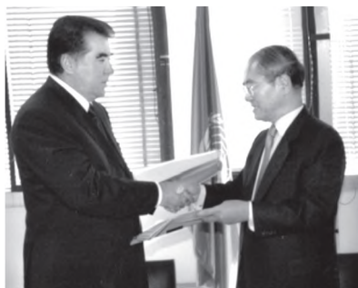
Дабири кулли ЮНЕСКО Коичи Матсуура ба Президент Эмомалӣ Раҳмон медали тиллоӣ супурда истодааст. Париж, октябри соли 2005