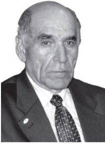
Ходими давлатию чамбиятӣ Қаҳҳор Маҳкамов

Қаҳҳор Маҳкамов 16 апрели соли 1932 дар ш. Хучанд дар оилаи коргар таваллуд шудааст. Маълумоти техникӣ дошта, Омӯзишгоҳи индустриалии Душанбе (соли 1950) ва До-нишкадаи кӯҳии ш. Ленинградро (соли 1953) хатм намуда, устои смена ва муҳандиси шахтаи Шӯроб шуда кор кардааст. Аз соли 1963 то соли 1982 аввал вазифаи Раиси Госплан ва сипас муовини Раиси Шӯрои Вазирони ҶШС Тоҷикистонро ба уҳда дошт.