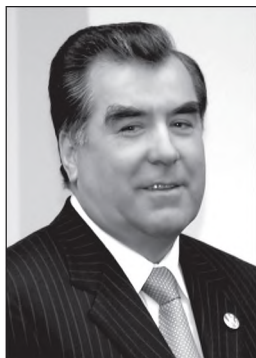
Қаҳрамони Тоҷикистон, Президенти Ҷумҳурии Тоҷикистон Эмомалӣ Раҳмон

Раиси Маҷлиси Олии Ҷумҳурии Тоҷикистон С. Раҷабов. ш. Душанбе, 11 декабри соли 1999, №923