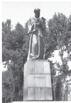
Мучассамии Абӯалӣ ибни Сино дар ш. Душанбе

Дар рафти чунин фестивал-озмунхо суннатҳои мардумӣ эҳё ва сайқал ёфта, як зумра ҷавонони эҷодкор ба майдони санъат меоянд. Хусусан, гузаронидани Ҳафтаи фарҳангии вилоятҳо (Сугд, Хатлон, Бадахшон), «Рӯзҳои фарҳанг» бахшида ба 20-солагии Истиқлолияти давлатии Тоҷикистон ба мустаҳкам гардидани дӯстии байни водию ноҳияҳо мусоидат мекунад. Таҷрибаи ташкил кардан ва фаъолияти гурӯҳҳои тарғиботӣ аз ҳисоби шоиру нависандагон ва санъаткорони шинохта низ аз аҳамият ҳоли нест.