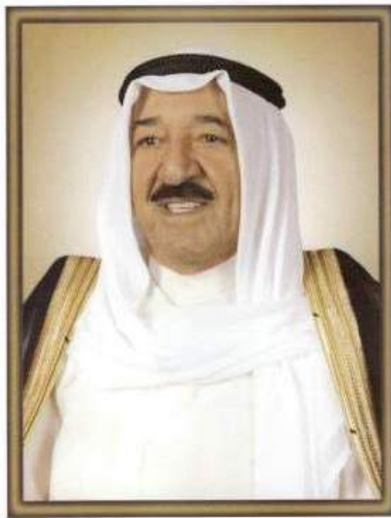
صاحب السمو الشيخ أحمد بن الفهد الصباح أمير دولة الكويت