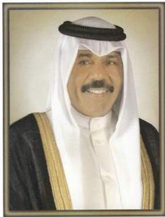
سَمَو الشَّيْخِ نَوَافِ بْنِ فَهْدِ بْنِ أَحْمَدَ بْنِ عَلِيِّ بْنِ الصَّبَاحِ وَلِيِّ عَهْدِ دَوْلَةِ الْكُوَيْتِ