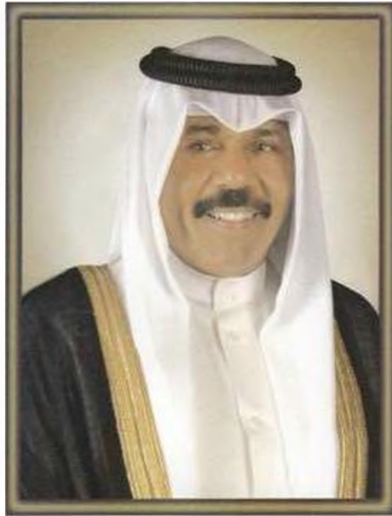
سَمُو الشَّيْخِ نَوَافِ بْنِ فَهْدِ بْنِ عَبْدِ الرَّحْمَنِ بْنِ الصَّبِيحِ وَلِيِّ عَهْدِ دَوْلَةِ الْكُوَيْتِ