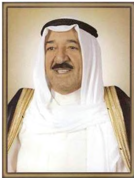
صاحب السمو الشيخ صباح الأحمد الجابر الصباح أمير دولة الكويت