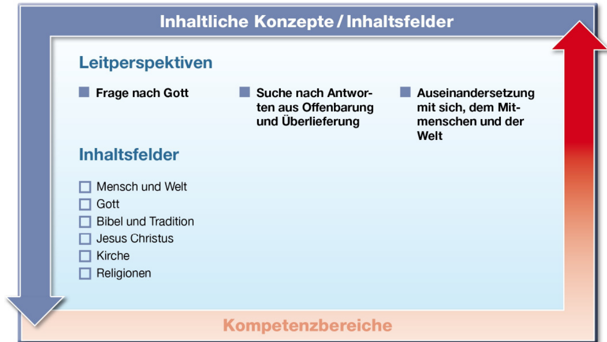
Abb. 2: Leitperspektiven und Inhaltsfelder im Fach Katholische Religion

Das inhaltliche Konzept des Faches Katholische Religion drückt sich in den Leitperspektiven „Frage nach Gott“, „Suche nach Antworten aus Offenbarung und Überlieferung“, „Auseinandersetzung mit sich, dem Mitmenschen und der Welt“ aus. Die Leitperspektiven erschließen sich in den sechs verbindlichen Inhaltsfeldern.