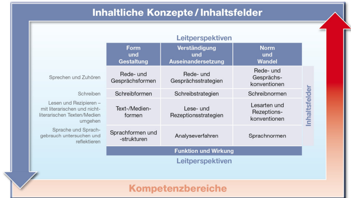
Abb. 2: Leitperspektiven, Inhaltsfelder und Kompetenzbereiche des Faches Deutsch