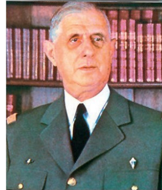
Շարլ դը Գոլ (1890-1970թթ.)

Չնայած տնտեսության բարելավմանը, երկրի ներքաղաքական կյանքն անկայուն էր: Կոալիցիոն կառավարություններն արագորեն փոխարինում էին մեկը մյուսին: Դժգոհությունը համակել էր ֆրանսիական ամբողջ հասարակությանը: Ֆրանսիան կարիք ուներ «ուժեղ ձեռքի»: 1958թ. հունիսի 1-ին Ազգային ժողովը Շարլ դը Գոլին նշանակեց երկրի վարչապետ: Ազգային ժողովից ստանալով արտակարգ լիազորություններ՝ դը Գոլը ցրեց ֆրանսիական պառլամենտը: Դրանով ավարտվեց Չորրորդ հանրապետության ժամանակաշրջանը: