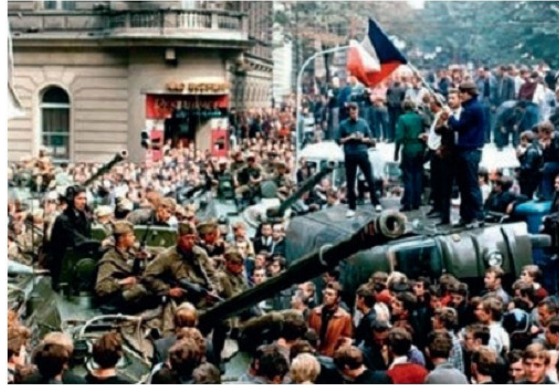
Տեսարան Չեխոսլովակիայում բռնկված սպասարարությունից, Պրահա, 1968 թ.

Եվ, վերջապես, 1990թ. ավարտվեց գերմանական երկու պետությունների միավորումը: