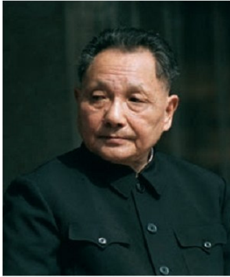
Դեն Սյաոպին (1904–1997 թթ.)

Մևտ Ցգեդունի մահը (1976թ. սեպտեմբերի 9): Դրանից հետո իշխանությունն անցավ Չինաստանի կոմունիստական կուսակցության նախկին գլխավոր քարտուղար Դեն Սյաոպինի ձեռքը: