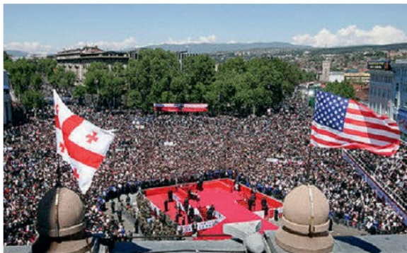
Տեսարան վարդերի հեղափոխությունից, Վրաստան, 2003թ., նոյեմբեր