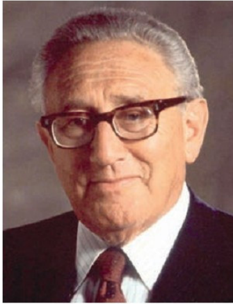
Հենրի Քիսինջեր (ծնվ. 1923 թ.)

նր: Համաշխարհային գործընթացները ցույց են տալիս, որ միջազգային հարաբերությունների կենտրոնը Արևմուտքից տեղափոխվում է Արևելք: Արևելքը համարվում է համաշխարհային կենտրոնի միակ արժանի թեկնածու, իսկ ավելի կոնկրետ՝ նրա Հարավարևելյան ասիական գոտին: Այստեղ են գտնվում այնպիսի հսկաներ, ինչպես Չինաստանը, Հնդկաստանը, Ճապոնիան և նրանց հարակից երկրները: Այստեղ են կենտրոնացված մեր մոլորակի մարդկության հիմնական մասը, բնական ռեսուրսների վիթխարի պաշարները, արդյունաբերության, առևտրի, ֆինանսների անպատելի ներուժը, համաշխարհային շուկաները: Դա բարձր տեխնոլոգիաների զարգացման համաշխարհային կենտրոններից մեկն է: Այս գոտում են գտնվում աշխարհի միջուկային զենք ունեցող յոթ երկրներից երեքը՝ Չինաստանը, Հնդկաստանը և Պակիստանը: Չինաստանն այսօր համարվում է համաշխարհային տնտեսության լոկոմոտիվը: Նշված փաստարկներն արդեն չեն վիճարկում գիտնականները և պետական գործիչները: Կենտրոնի՝ Արևելք տեղափոխվելու տեսակետն ընդունել են նաև ԱՄՆ-ի նախագահ Բարաք Օբաման և պետքարտուղար Հիլարի Քլինթոնը, ինչպես նաև այնպիսի ակադեմիկոս պետական գործիչներ և քաղաքագետներ, ինչպես Հենրի Քիսինջերը, Ջրիգնս Բժեժինսկին, Սեմյուել Հանթինգտոնը և աշխարհի այլ ականավոր դեմքեր: