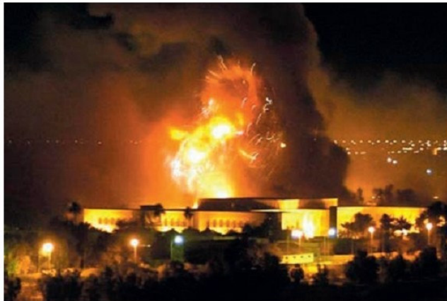
Տեսարան Իրաքի ունկրծությունից

Ինչ վերաբերում է կենտրոնի հարցին, ապա այն՝ միակենտրոն, երկկենտրոն կամ բազմակենտրոն, մեկ անգամ ընդմիջտ ստրված երևույթ չէ: Կենտրոնի յուրահատկություններից մեկը նրա շարժական լինելու հանգամանքն է, այսինքն այն մշտապես փոփոխվում է թե՛ թվաքանակի և թե՛ կոնկրետ պետության առումով: «Սառը պատերազմին» հաջորդեց միակենտրոն կամ միաբևեռ աշխարհը: Այժմ մարդկությունը գտնվում է համաշխարհային կամ միջազգային կենտրոնի հերթական տեղաշարժի նախօրյակին: ԱՄՆ-ի գերակայությամբ ձևավորված միակենտրոն աշխարհն արդեն սպառել է իրեն: