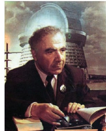
Վիկտոր Համբարձումյան (1908-1996 թթ.)

Արդի հասարակությունն այլևս անհնար է պատկերացնել առանց համացանցի, որը տիրապետող դեր է ստանձնել ոչ միայն տեղեկա-