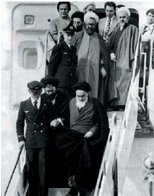
Այաթոլլահ Խոմեյնիի վերադարձը Իրան, 1979թ., փետրվար

Դրամատիկ բնույթ ընդունեցին Իրան-իրաքյան հարաբերությունները: 1980թ. աշնանն Իրանը և Իրաքը ներգրավվեցին երկարատև ու արյունալի պատերազմի մեջ, որն ավարտվեց 1988թ.: