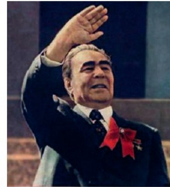
Լեոնիդ Բրեժնև (1906-1982 թթ.)

Վերանայելով խրուշչովյան տնտեսական քաղաքականությունը՝ խորհրդային ղեկավարությունը 1960-ական թթ. կեսերին սկսեց իրականացնել նոր բարեփոխումներ: Գյուղատնտեսության ոլորտում գյուղացիներին կրկին թույլ տրվեց վարել իրենց օժանդակ տնտեսությունները: Բարձրացվեցին կոլտնտեսությունների և պետական տնտեսությունների