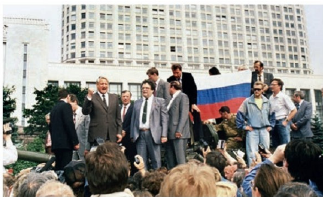
Բ. Ելցինը դատարարվում է խռովությունը, 1991 թ. օգոստոս