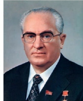
Յուրի Անդրոպով (1914 - 1984 թթ.)