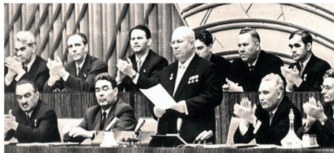
ԽՄԿԿ 20-րդ համագումարի բացմանը, 1956 թ.