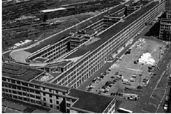
«ՖիԱՏ» գործարանի շենքը

Ակնառու նվաճումներ եղան նաև տնտեսության ոլորտում, և Իտալիան վերածվեց զարգացած արդյունաբերական ագրարային երկրի, որի արտադրանքն իր բարձր որակով լայն շուկաներ է նվաճել աշխարհում: Իտալիան ՆԱՏՕ-ի հիմնադիր անդամներից է, Եվրամիության, Եվրախորհրդի և համաեվրոպական այլ կառույցների գործույթ անդամ: