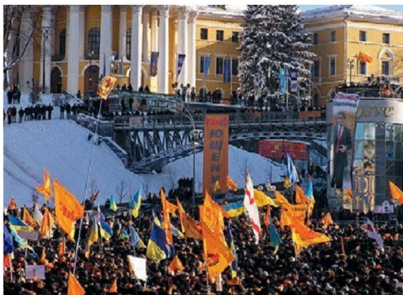
Տեսարան նարնջագույն հեղափոխությունից, Ուկրաինա, 2004թ., նոյեմբեր

հակառակորդներին ֆիզիկապես վերացնելու մեթոդը: Անհետատես քաղաքականության, տնտեսական զարգացման օրինաչափությունները ոտնահարելու հետևանքով շեշտակի անկում ապրեց ԱՊՀ երկրների տնտեսությունը, որն ուղեկցվում էր աշխատատեղերի կրճատումով, գործազրկության աճով, գների անկասելի բարձրացումով, խորհրդանշական աշխատավարձով և այլն: Դա իր հերթին բերեց արտագաղթ, գլխավորապես դեպի Ռուսաստան, ինչպես նաև ԱՄՆ, Ֆրանսիա, Իսպանիա, Բելգիա, Գերմանիա, Մեծ Բրիտանիա և այլ երկրներ: ԱՊՀ մի շարք երկրներում՝ Ռուսաստանում, Հայաստանում, Ուկրաինայում, Մոլդովայում և այլուր, սկսվեց դեմոգրաֆիկ ժողովրդական անկում: Վերոնշյալ բացասական երևույթները ԱՊՀ բոլոր երկրներում հանգեցրին սոցիալական բևեռացման՝ մի կողմում աղքատացում և թշվառություն, իսկ հակառակ կողմում՝ ճոխ ու հարուստ կյանք՝ վիլլաներ, այդ թվում արտասահմանյան երկրներում, թանկարժեք մեքենաներ, ռեստորանային շքեղ կյանք, ինչը դարձավ այսպես կոչված՝ նորաթուխ օլիգարխիայի, դուրսապրծուկների կենսաձևը: Մեկը մյուսին փոխարինող կառավարությունները, չնայած անպագոռոգո խոստումներին, լուրջ քայլեր