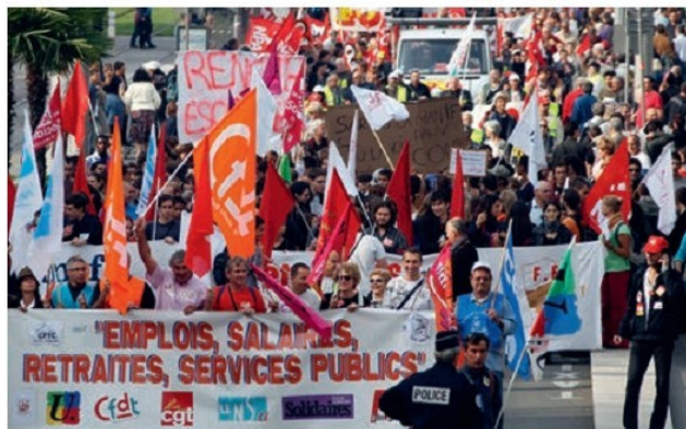
Հակագլոբալիստների հանրահավաք Նիցցայում

Համաշխարհայնացումը բոլոր երկրների համար չի կարող ունենալ միանշանակ հետևանքներ: Նրա ջատագովները բացահայտորեն հայտարարում են, որ շահողները կամ հաղթող-