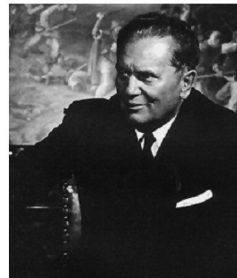
Իոսիպ Բրոզ Տիտ (1892–1980 թթ.)

Սոցիալիստական նոր երկրներն ազատ կերպով, իրենց կամքով չընտրեցին սոցիալիզմի զարգացման տարատեսակը: Նրանք պատճենահանեցին Մոսկվայի կողմից պարտադրված խորհրդային մոդելը: ԽՍՀՄ-ը