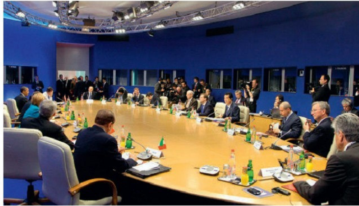
Գլոբալ հիմնահարցերի քննարկում Մեծ ութնյակի պետությունների ղեկավարների կողմից

նախկին ԽՍՀՄ-ի և սոցիալիստական համակարգի բոլոր երկրները: Գլոբալիզացիան անհնար կլիներ, համենայն դեպս, այդպիսի արագ տեմպերով չէր կարող զարգանալ առանց համացանցի՝ ինտերնետի, որի շնորհիվ արդի համաշխարհային հասարակությունը վերափոխվել է տեղեկատվական հասարակության: Համաշխարհայնացումն