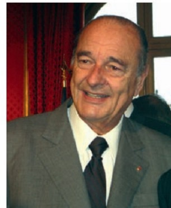
Ժակ Շիրակ (ծնվ. 1932 թթ.)