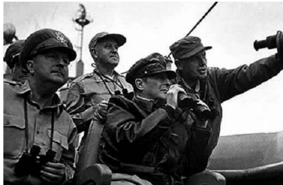
Ամերիկյան զենեքայները կորեական պատերազմի ժամանակ, 1950-1953 թթ.

«Մառը պատերազմը» մշտապես ուղեկցվել է տեղական՝ լոկալ, և տարածաշրջանային բազմաթիվ «տաք պատերազմներով»: Դրանցից առանձնանում են արաբա-իսրայելական հինգ պատերազմները, Լիբանան՝ ԱՄՆ-ի, Հորդանան՝ Մեծ Բրիտանիայի (1958թ.), Հունգարիա (1956 թ.) և Չեխոսլովակիա (1968թ.) խորհրդային զորքերի ներխուժումները: Տարածաշրջանային պատերազմներից պետք է նշել Վիետնամի պատերազմը՝ 1960-1970-ականներին, Թուրքիայի ներխուժումը Կիպրոս և նրա հյուսիսային շրջանների գրավումը 1974թ., խորհրդային զորքերի ագրեսիան Աֆղանստանում 1979թ., 1980-ականներին ԱՄՆ-ի ներխուժումը Գրենադա, բազմաթիվ ռազմական բախումներ և պատերազմական գործողություններ աֆրիկյան մայրցամաքում: