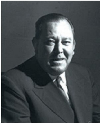
Տրյուգվե Լի (1896-1968 թթ.)

տոնյան է, որը նշանակվում է Գլխավոր ասամբլեայի կողմից՝ Անվտանգության խորհրդի երաշխավորությանը՝ հինգ տարի ժամանակով: ՄԱԿ-ի առաջին գլխավոր քարտուղար ընտրվեց Նորվեգիայի ներկայացուցիչ Տրյուգվե Լին: ՄԱԿ-ի պաշտոնական լեզուներն են՝ անգլերենը, իսպաներենը, չինարենը, ռուսերենը, ֆրանսերենը, արաբերենը: