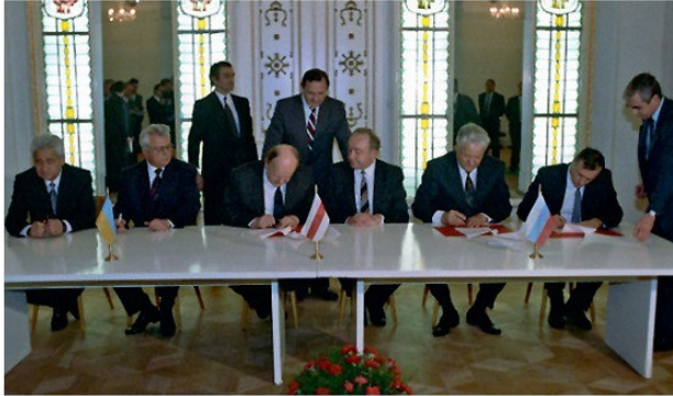
ԽՍՀՄ-ի փլուզման մասին համաձայնության ստորագրումը, Բելովեժսկ, 1991 թ. դեկտեմբեր