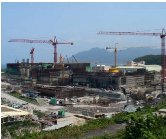
Արոմակայանի կառուցում, Չինաստան

Արագ տեմպերով զարգացան արդյունաբերության այնպիսի առաջատար և արդիական ուղղություններ, ինչպես մեքենաշինությունը, էլեկտրոնիկան, ավտոմոբիլային արդյունաբերությունը, ռազմական արդյունաբերությունը, ատոմային էներգետիկան (դեռևս 1964թ. Չինաստանն ստեղծել էր ատոմային զենք), սարքաշինությունը և այլն: Այս բոլորի շնորհիվ տեղի ունեցավ Չինաստանի տնտեսության ոչ միայն վերելք սովորական առումով, այլև արդիականացում, բարձրացավ մարդկանց կենսամակարդակը: Ի վերջո, Չինաստանը լուծեց սեփական պարենով իրեն ապահովելու խնդիրը, իսկ ապա՝ նաև արտահանման: