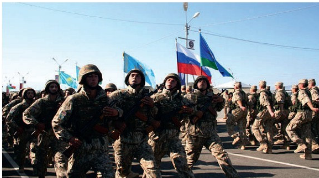
ՀԱՊԿ-ի անդամ երկրների զինվորների շքերթ