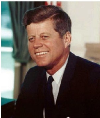
Ջոն Բենեդի (1917–1963թթ.)

Մյուս կողմից՝ խորհրդային տիպի ամբողջատիրական համակարգն ընդարձակեց իր ոլորտը՝ ներառելով արևելաեվրոպական և ասիական սոցիալիստական երկրները: Ասիայում, Աֆրիկայում և Լատինական Ամերիկայում կազմավորվեց այսպես կոչված՝ զարգացման ոչ կապիտալիստական կամ սոցիալիստական կողմնորոշման երկրների խումբը: Երկրների մի ստվար խումբ, դժգոհ «սառը պատերազմից», 1960-ականներին հիմք դրեց «Չմիավորված երկրների շարժմանը», որը գլխավորում էին Հնդկաստանը, Եգիպտոսը, Ինդոնեզիան և Հարավսլավիան: