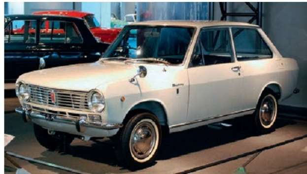
Ճապոնական ավտոմեքենա, 1960-ական թթ.

Իսկ ինչ վերաբերում է հասարակական-քաղաքական արդիականացմանը, ապա ընդունվեց