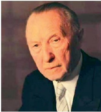
Կոնրադ Ադենաուեր (1876-1967թթ.)

ԳՖՀ-ի կայացման գործում մեծ էր Կոնրադ Ադենաուերի և Լյուդվիգ Էրհարդի դերը: ԳՖՀ-ն կարողացավ քավական կարճ ժամանակամիջոցում վերականգնել իր ավերված տնտեսությունը: «Մարշալի պլանով» ստացած միլիոնավոր դոլարների հասնող ֆինանսական օգնության շնորհիվ ԳՖՀ-ի տնտեսությունը տեխնիկապես վերագինվեց, ստեղծվեցին արդյունաբերության նոր ձյուղեր: Միտ երկու տասնամյակ