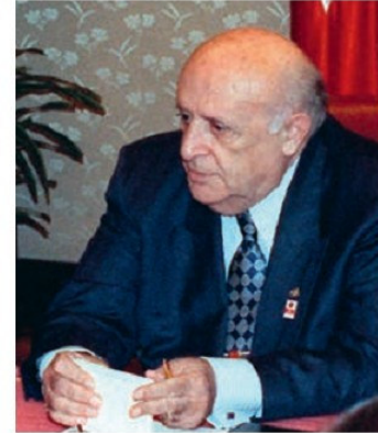
Սուլեյման Դեմիրել (ծնվ. 1924 թ.)

2002թ. իշխանության գլուխ եկավ «Արդարություն և զարգացում» կուսակցությունը՝ Ռեջեփ Էրդողանի գլխավորությամբ, որը երկար տարիներ իր ձեռքում պահեց երկրի կառավարման ղեկը: