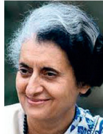
Ինդիրա Գանդի (1917–1984 թթ.)

Այս շրջանում խիստ սրվեցին կրոնաէթնիկական հարցերը: Իրենց ուրույն դավանանքն ունեցող սիկխերը պահանջում էին ստեղծել ինքնուրույն պետություն՝ Խալիստան: Ինդիրա Գանդին ճնշեց սիկխերի ապստամբությունը: 1984թ. օգոստոսին նա սպանվեց իր երկու սիկխ թիկնապահների ձեռքով: Դա ցնցեց ողջ Հնդկաստանը: 1984–1989թթ. վարչապետի պաշտոնում իր սպանված մորը փոխարինեց Ներուի թոռ Ռաջիվ Գանդին: 1991թ. նա ևս դարձավ սիկխերի վրեժխնդրության զոհը: Դրանով ավարտվեց մոտ 40 տարի տևած՝ Ներուի «դինաստիայի» կառավարման շրջանը: