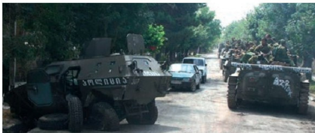
Տեսարան ռուս-վրացական պայքերագմից, 2008 թ. օգոստոս

տնտեսական գոտի ստեղծելու վերաբերյալ, որը բաց է ԱՊՀ-ի անդամ բոլոր երկրների առջև: Բայց մինչև օրս նրանցից և ոչ մեկը չի հայտարարել այդ պայմանագրին միանալու մտադրության մասին: