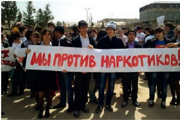
Թմրամոլության դեմ պայքարի շարժման մասնակիցներ

զանազան ուժեր, կազմակերպություններ և սինդիկատներ: Դա իսկական չարիք է մարդկության համար, որի դեմ հնարավոր է պայքարել աշխարհի բոլոր երկրների, կազմակերպությունների, ծառայությունների և բժշկության ամենաակտիվ ջանքերով: