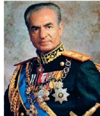
Մոհամմեդ Ռեզա Փահլավի (1919-1980 թթ.)

Իրագործվեց նաև ջրային պաշարների ազգայնացումն ու զարգա-