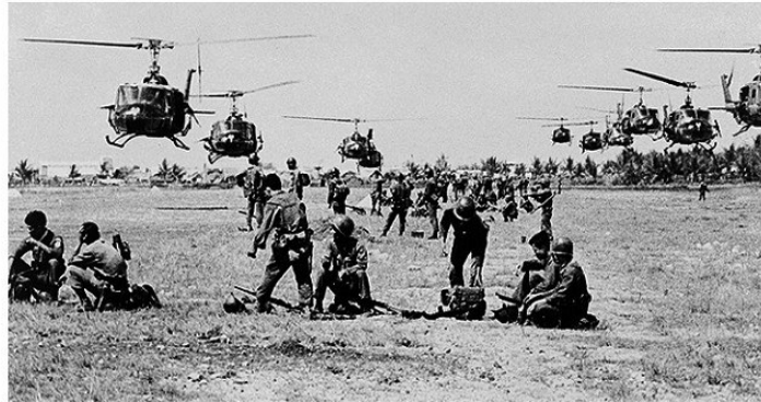
Ամերիկյան բանակի զինվորներ, Վիետնամ

Սակայն 1970-ական թվականների կեսերից դանդաղեցին ԱՄՆ-ի տնտեսական զարգացման տեմպերը, և խիստ աճեց գործազրկությունը: Երկրի տնտեսության առողջացման նպատակով պրեզիդենտ Ռոնալդ Ռեյգանը (1980–1988 թթ.) մշակեց համապատասխան ծրագիր, որն ստացավ «Ռեյգանոմիկա» անվանումը: Ռեյգանի տնտեսական ծրագիրը հարուստներին դարձնում էր ավելի հարուստ, իսկ աղքատներին՝ ավելի աղքատ: