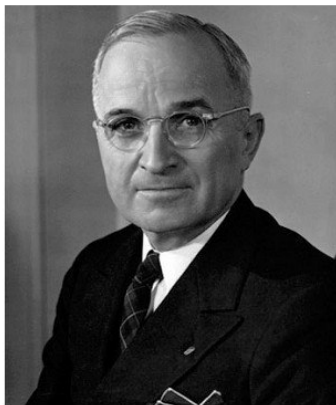
Հարրի Տրումեն (1884-1972 թթ.)

քերից» քաղաքականություն: Այսպիսով՝ աշխարհի երկու ամենահզոր տերություններն անցան առձակատման, որն ստացավ «սառը պատերազմ» անվանումը, ձևավորվեց երկբևեռ աշխարհ, շրջանառության մեջ մտավ «գերտերություն» հասկացությունը՝ ի դեմս ԱՄՆ-ի և ԽՍՀՄ-ի: