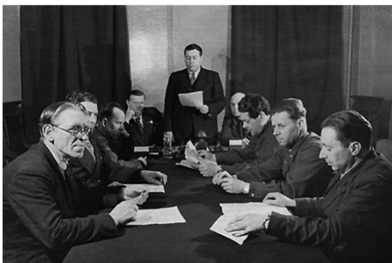
«Լենինգրադյան գործով» գումարված նիստ

ձգտում էին կենտրոնական իշխանությունից ավելի շատ անկախության և ինքնուրույնության: Ձերբակալվեցին Ա. Ժդանովի կողմից Լենինգրադից առաջ քաշված կուսակցական-պետական գործիչները: «Լենինգրադյան գործով» ձերբակալված 2000 մարդուց 200-ը դատի տրվեցին և գնդակահարվեցին: Դրանցից էին ՀամԿ(բ) Կ Կենտկոմի Քաղբյուրոյի անդամ և ԽՍՀՄ պետալլանի նախագահ Ն. Վոզնեսենսկին, ՀամԿ(բ) Կ Կենտկոմի