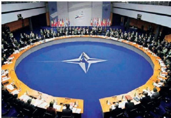
ՆԱՏՕ-ի անդամ երկրների նիստ

Ընդունված է, որ «սառը պատերազմի» սահազանգը տվեց ամերիկյան Ֆուլտոն քաղաքում Անգլիայի նախկին վարչապետ Ու. Չերչիլի 1946թ. մարտի 5-ի ելույթը, որին ներկա էր ԱՄՆ-ի նախագահ Հ. Տրումենը (1945-1953թթ.): Չերչիլը հայտարարեց, որ աշխարհին սպառնում է նոր՝ երրորդ համաշխարհային պատերազմի վտանգը, իսկ դրա աղբյուրը Խորհրդային Միությունը և միջազգային կոմունիզմն են: Նա առաջարկում էր ԽՍՀՄ-ի դեմ ստեղծել արևմտյան պետությունների դաշինք, նրա նկատմամբ վարել կոշտ քաղաքականություն: