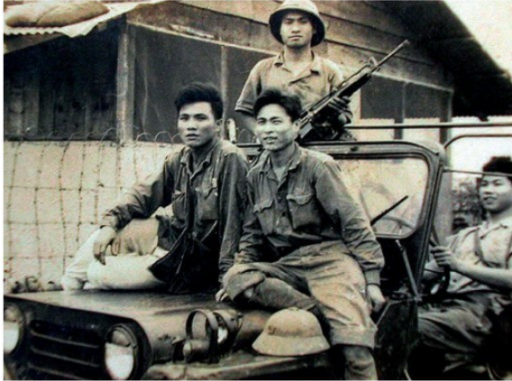
Հարավային Վիետնամի ազգային - ազա- րագրական ճակատի մարտիկներ

Հրապարակ եկան նոր մարտահրավերներ, որոնց մեջ, թերևս, ամենավտանգավորը էթնոքաղաքական հակամարտությունները և ազգամիջյան բախումներն էին: Դրանք զանգվածային բնույթ կրեցին XX դ. 80-ական թվականների վերջերին և 90-ական թվականների սկզբներին, հատկապես Խորհրդային Միության և Հարավսլավիայի լուծարումից հետո: Սակայն մի շարք հակամարտություններ, ինչպես արաբա-իսրայելական, քրդական, հնդկա-պակիստանյան և