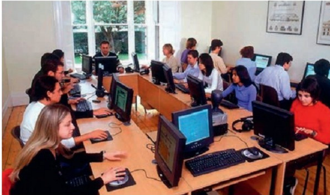
Համացանցից օգտվող մարդկանց խումբ

գահեռաբար խորանում են ժողովրդավարության, մարդու իրավունքների հարգման և ընդլայնման գործընթացները: Նշված ժամանակահատվածում ձևավորվեց միակենտրոն աշխարհ՝ ԱՄՆ-ի գլխավորությամբ: