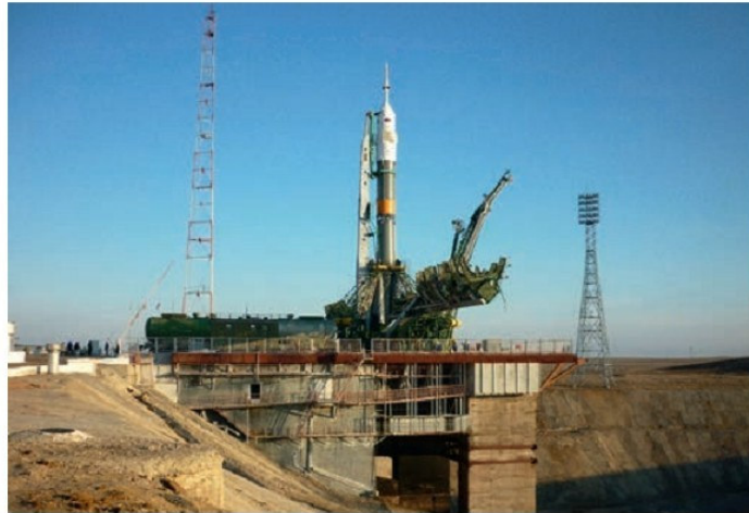
«Союз-ФГ» հրթիռի արձակումը

թյուններ, որոնք համալրվեցին նոր գիտնականներով և մասնագետներով, որը գլխավորում էին Օպենհայմերը և Ֆերմիին: Նրանց ջանքերով ԱՄՆ-ում ստեղծվեց ատոմային ռումբ, իսկ Կուրչատովի գլխավորությամբ, Ա. Ալիխանովի և այլոց ջանքերով ստեղծվեց խորհրդային միջուկային զենքը: Ա. Սախարովը դարձավ ջրածնային ռումբի հայրը, նման կոչման արժանացավ Թեյլերը ԱՄՆ-