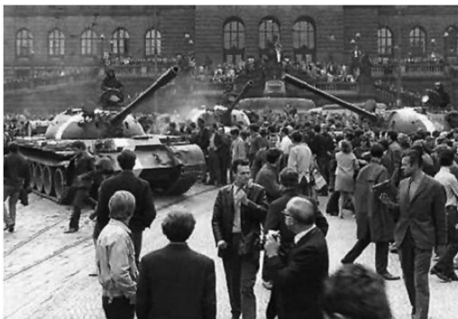
Տեսարան Հունգարիայի ապստամբությունից, 1956 թ.

Եվրոպական սոցիալիստական երկրներին պարտադրելով խորհրդային մոդելը՝ խորհրդային ղեկավարությունն անտեսեց այն հանգամանքը, որ դրանք ժողովրդավարությանը վարժված երկրներ էին, որտեղ հարգում էին խոսքի, մամուլի, միությունների ազատությունը և բազմակարծությունը: Դրանց բացակայությունը, որ ի հայտ եկավ այդ երկրներում սոցիալիստական հռչակվելուց հետո, եղավ խոր և համազգային դժգոհության առաջին պատճառը: Մյուս պատճառը տնտեսական ծանր վիճակն էր, որի մեջ հայտնվեցին այդ երկրները: Սկզբում նրանք հավատում էին, որ սոցիալիզմը կնպաստի իրենց երկրների զարգացմանը և առաջընթացին, նրանց կապահովի բարեկեցիկ և քաղաքակիրթ կյանքով: Շուտով ակնհայտ դարձավ, որ կապիտալիզմի հետ մրցության մեջ սոցիալիզմը տանուլ է տալիս: Այդ երկրներում սկսվեց տնտեսական անկում, պարենամթերքի և ապրանքների պակաս, ինչպես ԽՍՀՄ-ում էր, գների աճ և տնտեսական դրության կտրուկ վատթարացում: Բայց այդ դժգոհությունը պոռթկումի վերածվելու համար անհրաժեշտ էին բարենպաստ պայմաններ, որոնք սոցիալիստական համակարգում ստեղծվեցին 1953թ.՝ բռնակալ Իոսիֆ Ստալինի մահվանից հետո ԽՍՀՄ-ում որոշ փոփոխությունների հետևանքով: Արդեն 1953թ. օգոստոսին լայնածավալ հուզումներ տեղի ունեցան Գերմանիայի Դեմոկրատական Հանրապետությունում: 1956թ. գինված