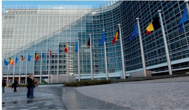
Եվրոպական միության նստավայրը, Բրյուսել

տնտեսական զարգացման, ազատականության և ժողովրդավարության բարձր մակարդակ. նրա բյուջեն պետք է լինի հավասարակշռված, երկիրը չպետք է գտնվի պատերազմի և բախումների մեջ և այլն: Այնուհանդերձ, ԵՄ-ի շարքերը համալրվում են, և նրա անդամների թիվը 2012թ. հասավ 27-ի: