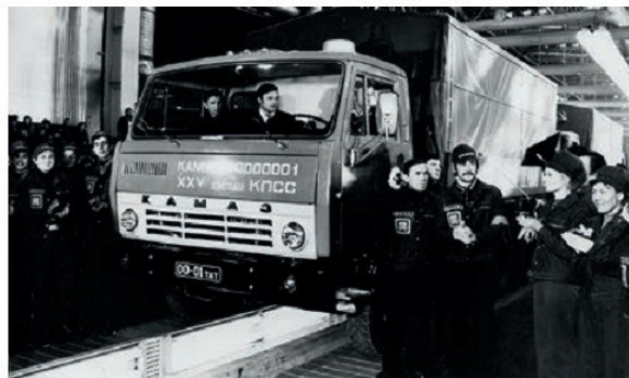
Տեսարան «Կամազ» գործարանից

(սովխոզների) արտադրանքի գնման գները: Կոլտնտեսություններում մտցվեցին կայուն դրամական դրույքներ: Արդյունաբերության մեջ բարձրացվեց ձեռնարկությունների տնտեսական ինքնուրույնությունը, մտցվեց արտադրողների նյութական խրախուսման համակարգը և այլն: Այս միջոցառումները սկզբնական շրջանում որոշակի արդյունք տվեցին: Պաշտոնական տվյալներով մինչև