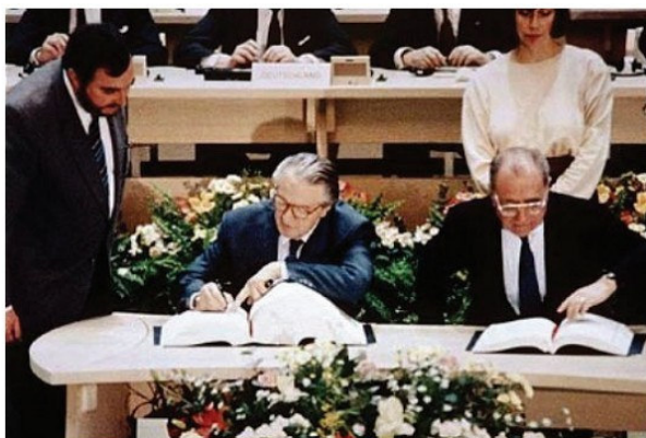
Եվրոպական միության սրեղծման համաձայնագրի ստորագրումը

Արևմտյան երկրների ինտեգրացումն իր գործնական արտացոլումը գտավ Եվրոպական միության (ԵՄ) ստեղծման մեջ: ԵՄ-ի կազմավորումն ընթացել է փուլ առ փուլ: Նրա հիմքերը դրվեցին դեռևս 1952թ., երբ Ֆրանսիան, Գերմանիան, Իտալիան, Բելգիան, Նիդերլանդները և Լյուքսեմբուրգը հիմնեցին Եվրոպական ածխի և պողպատի միավորումը: 1957թ. նրանք ստորագրեցին համաձայնագիր Եվրոպական տնտեսական միություն ստեղծելու մասին, որն ավելի հայտնի դարձավ Ընդհանուր շուկա անունով: Այնուհետև ինտեգրացման գործընթացն անցավ մի շարք միջանկյալ փուլերով և, վերջապես, 1992թ. եվրոպական 12 երկրներ ստորագրեցին մի շարք համաձայնագրեր, և ստեղծվեց Եվրոպական միությունը: Սահմանվեցին նրա հիմնական խնդիրները, որոնք հանգում էին հետևյալին՝ ստեղծել միասնական տնտեսական, իրավական և մշակութային տարածք: Անդամ երկրների քաղաքացիները, նրանց կապիտալը և բանվորական ուժը ստացան ազատ տեղաշարժվելու իրավունք ԵՄ-ի անդամ երկրների տարածքում: ստեղծվեց ԵՄ-ի միասնական դրամ՝ եվրոն, և այլն: ԵՄ-ն ազատորեն չի բացում իր դռները բոլոր ցանկացողների առջև. ունի խիստ նախապայմաններ: Նորանդամ պետությունը պետք է ունենա