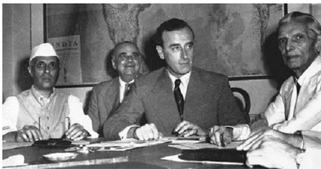
Հնդկաստանի ղեկավարների պայրասարվելը Բրիտանիայից իշխանության սրանձնմանը, 1947 թ. օգոստոսի 15-ից 11 օր առաջ