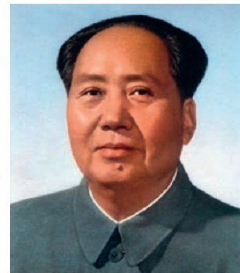
Մաո Ցզեդուն (1893–1976 թթ.)