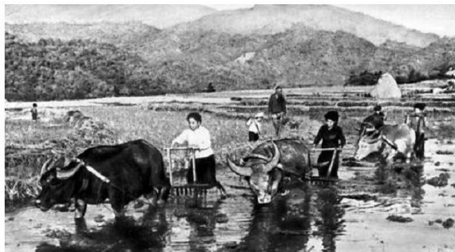
Աշխատանք բրնձի դաշտում, Լաոս

Գաղութների ժողովուրդները երկարատև ու համառ պայքար են մղել օտարերկրյա տիրապետության տապալման և ազգային անկախության