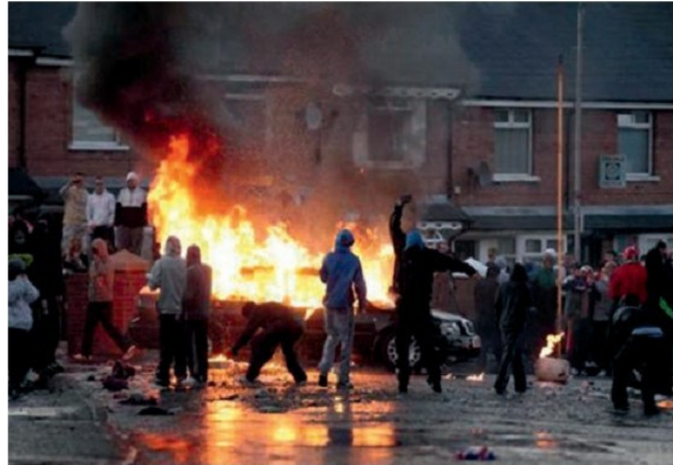
Բախում կաթոլիկների և բողոքականների միջև, Հյուսիսային Իռլանդիա

Ֆրանսիան 1992թ. հունվարի 3-ին ճանաչել է Հայաստանի Հանրապետության անկախությունը, փետրվարի 24-ին հաստատել դիվանագիտական հարաբերություն-