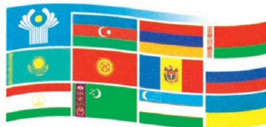
ԱՊՀ-ի և նրա անդամ երկրների դրոշները

ԱՊՀ-ն դեռևս 1993թ. օժտվել էր համապատասխան Կանոնադրությամբ, ըստ որի՝ որպես գլխավոր գործադիր մարմին հաստատվեց Գործադիր կոմիտեն: Նրա նախագահը Գործադիր կոմիտեն ղեկավարում է ռոտացիոն սկզբունքով, ըստ այբբենական կարգի, և փոխարինվում է յուրաքանչյուր տարի: Դա մշտապես գործող մարմին է, որի անդամներն են այն բոլոր երկրների նախագահները, որոնք ստորագրել են ԱՊՀ-ի Կանոնադրությունը: Նշենք, որ այդ կարևոր փաստաթուղթը չէին ստորագրել Ուկրաինան, Թուրքմենիան և Մոլդովան: Փաստորեն մշտական հանձնաժողովների կարգավիճակով են գործում նաև ԱՊՀ երկրների վարչապետների, պաշտպանության նախարարների, արտաքին գործերի նախարարների և Ազգային անվտանգության խորհուրդների քարտուղարների համաժողովները: Շատ կարևոր մարմին է համարվում Հավաքական անվտանգության պայմանագրի կազմակերպությունը (ՀԱՊԿ), որը սակայն չի ընդգրկում ԱՊՀ-ի բոլոր անդամ երկրներին: Նրա անդամներն են վեց պետություն՝ Բելառուսը, Հայաստանը, Դազախստանը, Դրոլըզստանը, Ռուսաստանը և Տաջիկստանը: Նրա կազմից վերջերս դուրս եկավ Ուզբեկստանը: ՀԱՊԿ-ի գլխավոր խնդիրն է՝ ապահովել անդամ երկրների ազգային անվտան-