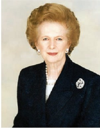
Մարգարեի Թեոչեր (1925-2013 թթ.)

տարիներին դանդաղ էր ընթանում նրա տնտեսության վերականգնումը: Անգլիական ապրանքները մրցունակ չէին: Լեյբորիստների կառավարման տարիներին՝ 1945-1951թթ., ազգայնացվեցին տնտեսության մի շարք ձյուղեր՝ քարածխի արդյունահանումը, պողպատաձուլությունը, երկաթուղային և ջրային տրանսպորտը, Անգլիական բանկը, էլեկտրակայանները և այլն: Դրանց տերերը մեծ փոխհատուցումներ ստացան: Մոցվեցին անվճար բուժում և ուսուցում: