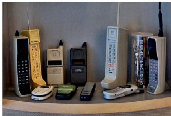
Առաջին բջջային հեռախոսները

Լայնորեն կիրառվում են համացանցի այնպիսի բաղադրիչներ՝ ինչպես էլեկտրոնային փոստը, ֆաքսը, բջջային հեռախոսները: Արդի համաշխարհային շուկան նույնպես խարսխավել է էլեկտրոնիկայի և համացանցի վրա: Այդ բոլորի արդյունքում ձևավորվել է սոցիալական նոր խավ՝ որի միջուկը կազմում են ծրագրավորողները, պարտադիր բարձրագույն կրթություն և գի-