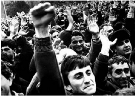
Տեսարան Ղարաբաղյան շարժումից, 1988 թ.