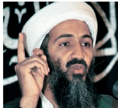
Օսամա Բեն Լադեն (1957–2011 թթ.)

Ահաբեկչություն: Գլոբալ խնդիրների շարքում, որոնք շոշափում են համայն մարդկության շահերը, իր վտանգավորությամբ աչքի է ընկնում միջազգային ահաբեկչությունը: Այն տարածված է աշխարհի բոլոր մասերում՝ Եվրոպայում (Իռլանդիա, Մեծ Բրիտանիա, Գերմանիա, Ֆրանսիա և այլն), Ասիայում, հատկապես Թուրքիայում, ինչն ուղղված է հայերի, հույների և այլ քրիստոնյաների, քրդերի դեմ, Իրանում, արաբական մի շարք երկրներում, Հարավային Ամերիկայում և այլուր: Հանցավոր ինտերնացիոնալ բանդիտական խմբավորումների կազմավորումը, մարդկանց պատանդ վերցնելը, ինքնաթիռների առևանգումը, շենքերի և ավտոմեքենաների պայթեցումները, պատվիրված սպանությունները (որի զոհը Թուրքիայում դարձավ «Ակոս» թերթի խմբագիր և ականավոր հասարակական գործիչ Հրանտ Դինքը) և այլ ահաբեկչական գործողություններ լուրջ սպառնալիք են ազգային և միջազգային անվտանգությանը: Պայքարը ահաբեկչության դեմ պահանջում է այն ծնող պատճառների վերացում և գլոբալ ջանքերի համադրում, համատեղ կանխիչ և պատժիչ գործողություններ: