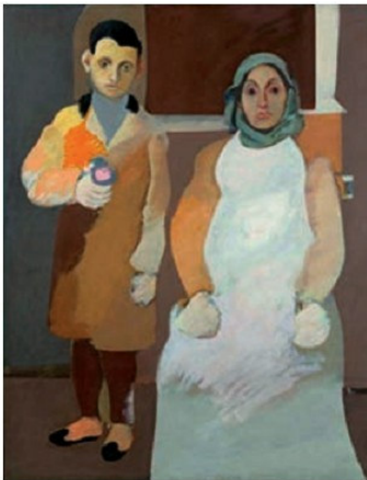
«Նկարիչն ու իր մայրը» Արշիլ Գորկի