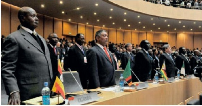
Աֆրիկյան միության երկրների ներկայացուցիչների 19-րդ կոնֆերանսի բացումը

ները լինելու են արևմտյան հասարակությունները՝ ԱՄՆ-ը և Արևմտյան Եվրոպայի երկրները, իսկ կորցնողները՝ արևելյան հասարակությունները՝ Ասիայի, Աֆրիկայի և Հարավային Ամերիկայի զարգացող ու թույլ զարգացած երկրները: Համաշխարհայնացման ներկա ուղղվածությունը խիստ անհանգստացնում է թույլ զարգացած երկրները: