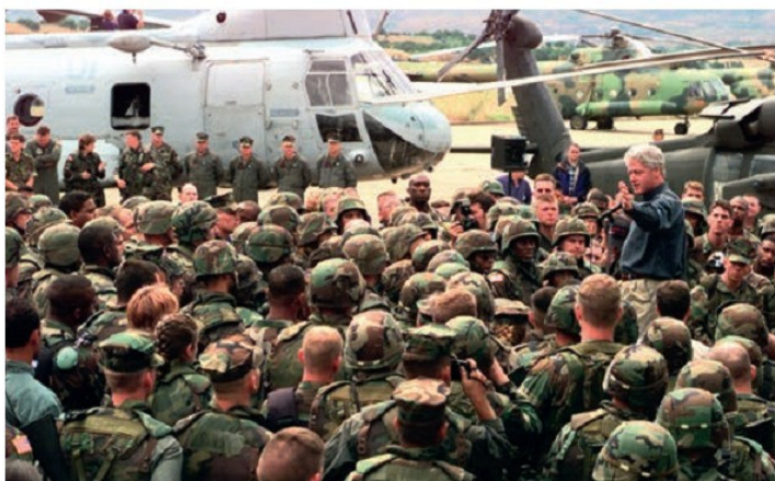
Բ. Բլինչթոնի հանդիպումը Կոսովո ուղարկվող՝ ՆԱՏՕ-ի զինվորների հետ

Ինչ վերաբերում է Հայաստանին, ապա նրա դեկլարությունը բազմիցս պաշտոնապես հայտարարել է, որ իր քաղաքական օրակարգում չկա ՆԱՏՕ-ին անդամակցելու հարց: Սակայն դա չի խանգարում, որ մի շարք բնագավառներում գործնական հա-