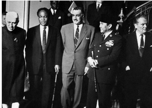
«Չմիավորված երկրների շարժման» ղեկավարների հանդիպումը Հարավսլավիայում, 1961 թ., սեպտեմբեր

իսկ երկրորդը՝ սոցիալիստական աշխարհը՝ ԽՍՀՄ-ի գլխավորությամբ: Իրադրությունը կտրուկ փոխվեց, երբ կործանվեց գաղութային համաշխարհային համակարգը, և քաղաքական ասպարեզում հայտնվեցին Ասիայի և Աֆրիկայի գաղութային տիրապետությունից ազատագրված և անկախություն նվաճած երկրները: Հենց նրանք էլ կազմեցին «Երրորդ աշխարհը» կամ նրա կորիզը, որին միացավ նաև Հարավային Ամերիկայի երկրների մեծ մասը: Այդ երկրների