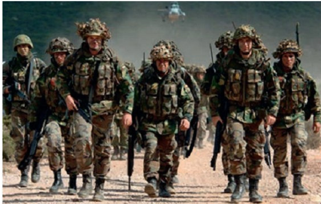
ՆԱՏՕ-ի զորքերի մուտքն Աֆղանստան

րաբերություններ հաստատվեն ՆԱՏՕ-ի և Հայաստանի Հանրապետության միջև: Առանձնապես պետք է նշել Հայաստանի և ՆԱՏՕ-ի միջև 2005թ. ստորագրված Անհատական գործընկերության գործողությունների ծրագիրը: Հայաստանի տարածքում անցկացվել են ՆԱՏՕ-ի զորքերի և հայկական զորքերի համատեղ զորավարություններ, զինավարժություններ: