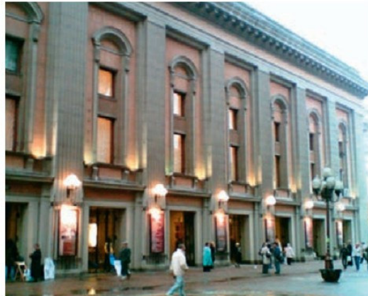
Վախթանգովի թատրոնը Մոսկվայում

Արվեստի համեմատաբար նոր ժանր է կինոարվեստը, որը շատ կարճ ժամանակաշրջանում նվաճեց միլիոնավոր մարդկանց սերն ու համակրանքը: Ժանրային առումով այն տարատեսակ է՝ գեղարվեստական, փաստագրական, մուլտիպլիկացիոն, երաժշտական և այլն: Նրա լսարանը սահմաններ չի ձանաչում, և այդ առումով ամենաժողովրդական արվեստն է: Քննարկվող ժամանակաշրջանում միջազգային մեծ ձանաչում ստացան ամերիկյան մի շարք կինոռեժիսորներ՝ Ս. Կրամերը, Ս. Սպիլբերգը, Ֆ. Կոպպոլան, Ռ. Մանոյլանը և ուրիշներ: Մեծ հռչակ ձեռք բերեցին Ռ. Ռոսելլինիի, Դե Սիկայի, Լ. Վիսկոնտիի, Մ. Անտոնիոնիի, Բ. Բերտոլուչիի (իտալական կինոդպրոց), Կուրոսավայի (Ճապոնիա) և Ի. Բերգմանի (Շվեդիա) գեղարվեստական ֆիլմերը: Կինոարվեստի երկնակամարում փայլատակեցին այնպիսի աստղեր, ինչպիսիք էին՝ Գրետա Գարբոն, Մերիլին Մոնրոն, Մառլոն Բրանդոն, Շերը (Շերիլին Սարգսյան, ԱՄՆ), Աննա Մանյանին, Սոֆի Լորենը, Մարչելլո Մաստրոյանին (Իտալիա), Ժան Գաբենը, Բրիջիտ Բարդոն (Ֆրանսիա), Վիվիան Լին, Չարլզ Լոուտոնը (Անգլիա) և այլք: Անգուգական վարպետների և բեմադրիչների առաջին շարքերում էին Ֆեդերիկո ֆելինին, Սերգեյ Փարաջանովը, Անդրեյ Տարկովսկին, Ա. Փելեշյանը և ուրիշներ: