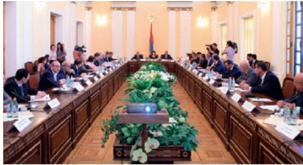
ՀԱՊԿ անդամ պետությունների խորհրդարանների պաշտպանության և անվտանգության մշտական հանձնաժողովների նախագահների համակարգող խորհրդակցության նիստը Երևանում

Հայաստանը և Ռուսաստանը ԱՊՀ անդամ միակ պետություններն են, որ դեռևս 1997թ. օգոստոսին ստորագրել են «Բարեկամության, համագործակցության և փոխադարձ օգնության պայմանագիր», որը մինչև օրս ծառայում է Հայաստանի ազգային անվտանգության շահերին: Այդ պահից ի վեր հայ-ռուսական հարաբերությունները երկու կողմերն էլ որակում են որպես ռազմավարական հարաբերություններ: Հայաստանը Ռուսաստանին տրամադրել է ռազմակայան Գյումրիում, որտեղ հայ և ռուս սահմանապահները համատեղ պաշտպանում են Հայաստանի պետական սահմանները, այդ թվում և նրա թուրքական հատվածը: 2011թ., Ռուսաստանի Դաշնության նախագահ Ա. Մեդվեդևի՝ Հայաստան պետական այցի շրջանակներում, կողմերը եկան համաձայնության՝ երկարաձգել ռազմակայանի գործողության ժամկետը հիսուն տարով: Շատ ակտիվ է Հայաստանի գործունեությունը ՀԱՊԿ-ում՝ ԱՊՀ-ի ամենակարևոր մարմիններից մեկում: Հայաստանը հիանալի է դրսևորել իրեն այդ կառույցի նախագահի պաշտոնում, մեծապես նպաստում է նրա՝ որպես միջազգային կառույցի կայացմանը: ՀԱՊԿ-ն պարբերաբար զորավարժություններ է անցկացնում Հայաստանի տարածքում՝ ռազմական ժամանակակից զենքի տեսակների օգտագործմամբ, որը կարևոր է Հայաստանի զինված ուժերի կատարելագործման և մարտունակության բարձրացման տեսանկյունից: