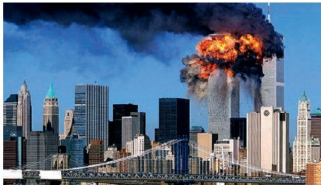
Նյու Յորքի երկնաքերների ունկնդրումը ահաբեկիչների կողմից, 2001թ. սեպտեմբերի 11

սեպտեմբերի 11-ին իսլամական ահաբեկիչները «ալ-Կաիդայի» ղեկավար Ուսամա բեն Լադենի հրահանգով կործանեցին Նյու Յորքում տեղակայված համաշխարհային առևտրի կենտրոնի երկու երկնաքերները՝ պատճառելով մարդկային մեծ զոհեր և ավերածություններ: Բուշ կրտսերին արտաքին հարաբերություններում հատուկ էր ագրեսիվ