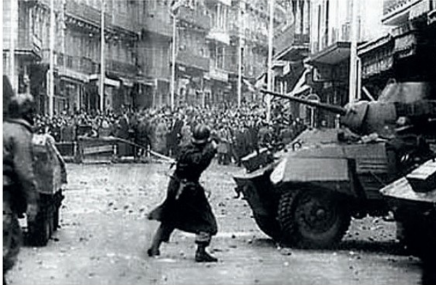
Տեսարան ազգային-ազատագրական պայտերազմից, 1954-1962 թթ., Ալժիր

խարհային պատերազմի սկզբում, ամենահզոր գաղութային պետության՝ Բրիտանական կայսրության, թուլացումը պատերազմի ընթացքում, ԱՄՆ-ի և ԽՍՀՄ-ի հակագաղութային արտաքին քաղաքականությունը: Այս երկու պետություններն էլ հանդես էին գալիս գաղութային համակարգը վերացնելու պահանջով: Այս բարենպաստ գործոնների շնորհիվ XX դարի 40-70-ական թվականներին վերջնականապես փլվեց գաղութային համաշխարհային համակարգը: