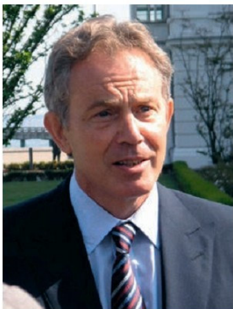
Թոնի Բլեր (ծնվ. 1963 թ.)

Մեծ Բրիտանիա: 1997թ. կայացած պառլամենտական ընտրություններում հաղթեցին լեյբորիստները, և նոր կառավարությունը գլխավորեց նրանց առաջնորդ Թոնի Բլերը: Նա համարձակորեն ընդառաջ գնաց շտաբանագիտակների և ուելսցիների ինքնավարման պահանջներին: 1997թ. Շտաբանագիտակները տեղի ունեցավ հանրաքվե՝ հոգուտ սեփական պառլամենտ ստեղծելուն: Շտաբանական պառլամենտն օրենսդրական իրավունք ստացավ տեղական հարցերում: Նույնպիսի իրավունքներով օժտվեց նաև Ուելսում ստեղծված տեղական պառլամենտը: