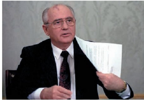
Մ. Գորբաչովի հրաժարականը, 1991թ. դեկտեմբերի 25

բերի 21-ին Ալմա-Աթայում կայացած հանդիպման ժամանակ ևս 8 հանրապետություններ (առանց մերձբալթյան հանրապետությունների ու Վրաստանի) մտան ԱՊՀ-ի մեջ և վերջնականապես հայտարարեցին ԽՍՀՄ-ի գոյության դադարեցման մասին: 1991թ. դեկտեմբերի 25-ին Մ. Գորբաչովը հրաժարական տվեց: ՀՀ-ն հենց սկզբից անդամագրվեց ԱՊՀ-ին և ակտիվ մասնակցություն ունեցավ այդ կառույցի կայացմանը: