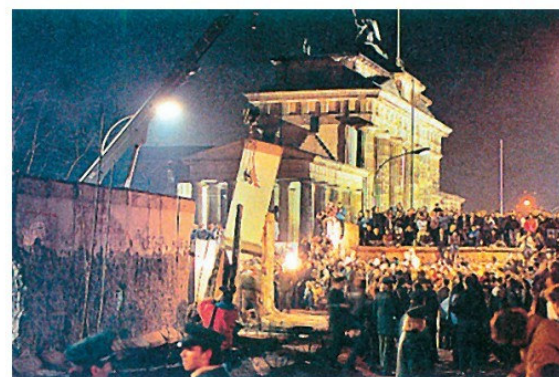
Բեռլինի պատի քանդումը, 1989 թ., նոյեմբեր