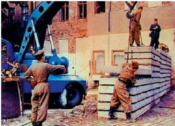
Բեռլինի պարի կառուցումը, 1961 թ., օգոստոս

ԳՖՀ-ի բուռն զարգացումը հասավ նոր բարձունքների Հելմուտ Կոլի վարչապետության շրջանում (1982-1989թթ.): ԳՖՀ-ն դարձավ նաև եվրոպական քաղաքական, տնտեսական և ռազմական կառույցների անդամ: ԳՖՀ-ն 1955թ. անդամակցեց ՆԱՏՕ-ին, իսկ 1973թ. դարձավ ՄԱԿ-ի անդամ: