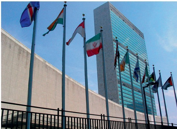
ՄԱԿ-ի նստավայրը Նյու Յորքում

ՄԱԿ-ի գլխավոր սկզբունքներն են՝ ազգերի ինքնորոշման իրավունքի ընդունումը որպես միջազգային իրավունքի ամենակարևոր սկզբունքներից մեկը, միջազգային համագործակցությունը, պետությունների ներքին գործերին չմիջամտելը, միջազգային վեճերը խաղաղ միջոցներով