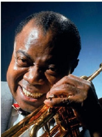
Լուի Արմսթրոնգ (1900-1971 թթ.)

պատկանում էր Նյու Յորքի և եվրոպական դպրոցների: Համաշխարհային վարպետների՝ Պիկասոյի, Մատիսի, Լեժեի, Շագալի, Դալիի կողքին հայտնվեցին նորերը, ինչպես Փոլոքը, ամերիկյան վերացական գեղանկարչության հիմնադիր Արշիլ Գորկին (Ոստանիկ Ադոյանը) և շատ ուրիշներ: Ասպարեզում հայտնվեց պոպ-արտը, որի հետևորդները գտնում էին, որ ամեն իր կարող է լինել արվեստի առարկա: Նրանցից հայտնի էին Ռուշենբերգը, Ջոնսը և Օլդենբուրգը: Ավանգարդային ուղղություններ էին հիպերռեալիզմը, կոնցեպտուալիզմը, որն արվեստը դիտում է որպես հաղորդակցություն: