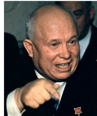
Նիկիտա Խրուշչով (1894-1971 թթ.)

1956-1961թթ. արդարացվեց ավելի քան 700 հազար մարդ, վերականգնվեց նրանց բարի անունը և հիշատակը: Վերակառուցվեցին պետական մարմինները, կուսակցական և հասարակական կազմակերպությունները: Ընդլայնվեցին միութենական