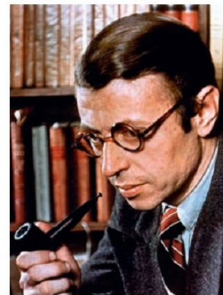
Ժան Պոլ Սարտր (1908–1980 թթ.)

Նշված ժամանակաշրջանում բուռն զարգացում ապրեց գրականությունը, որն իր ոլորտում ներառեց ոչ միայն ավանդաբար մեծ և զարգացած գրականություն ունեցող երկրները, այլև Ասիայի, Աֆրիկայի և Հարավային Ամերիկայի երկրները: Իր տաղանդով փայլեց ամերիկյան քառյակը՝ Ֆոկները, Հեմինգուեյը, Սարոյանը և Ստեյնբեկը: Ձևավորվեց մոդեռն գրական ուղղությունը, որի առաջատարներն էին ֆրանսիացի հեղինակներ Սարտրը և Քամյուն, ասպարեզ իջավ ավանգարդիստ Է. Իոնեսկուն: 1960–1980–ականներին գրողների առաջին շարքերում հայտնվեցին լատինամերիկացիներ Խուլիո Կորտասարը և Գաբրիել Գարսիա Մարկեսը: Ընթերցողների ուշադրության կենտրոնում էին հայտնվել գերմանական գրող Հ. Բյուլը, ֆրանսուհի Ֆ. Սագանը, Բագենը, Դուրենմանը և ուրիշներ: Թեև, քաղաքական պայմաններից ելնելով, ծանր վիճակում էր հայտնվել խորհրդային և հետխորհրդային գրականությունը, այնուհանդերձ, արժեքավոր գործեր ստեղծեցին Ա. Սոլժենիցինը, Ա. Տվարդովսկին, Կ. Սիմոնովը, Հրանտ Մաթևոսյանը, Ա. Բիտովը և շատ ուրիշներ: «Ձևալի» շրջանում իրենց տաղանդով փայլեցին Ե. Եվտուշենկոն, Յու. Վոզնեսենսկին, Պ. Սևակը, Ռ. Ռոժդեստովենսկին, Հ. Մահյանը և ուրիշներ: Իսկ այն գրողներին, ովքեր ընդդիմադիր դիրքորոշում ունեին վարչակարգի հանդեպ, իշխանությունները, համարելով դիսիդենտ՝ այլախոհ, կամ արտաքսում էին երկրից, ինչպես Սոլժենիցինին, Բրոդսկուն, կամ արքտորում և կամ էլ ուղարկում հոգեբուժարաններ: Այդ հակամարդկային քաղաքականությանը վերջ տրվեց վերակառուցմանը հաջորդած շրջանում: