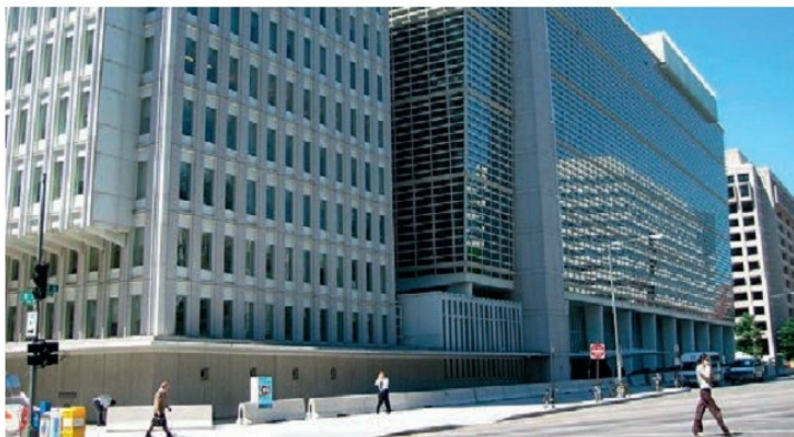
Համաշխարհային բանկի շենքը Վաշինգտոնում

դարաշրջանում տնտեսական հարաբերությունների միակ ընդունելի ձևը բոլոր երկրների համար ազատ շուկայական հարաբերություններն են: XXI դ. սկզբից տնտեսական հարաբերությունների այդ ձևը հանդիսանում է տիրապետող ամբողջ աշխարհում, որի մեջ ներգրավվեցին նաև