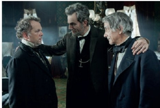
Դրվագ Սպիլբերգի «Լինկոլն» ֆիլմից