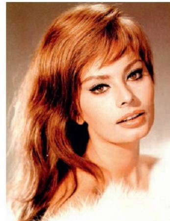
Սոֆի Լորեն (Իտալիա) (ծնվ. 1934 թ.)