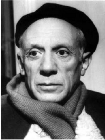
Պաբլո Պիկասո (1881-1973 թթ.)