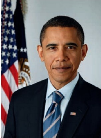
Բարաք Օբամա (ծնվ. 1961 թ.)

վերաբերյալ: Նա փորձում է կիրառել մի շարք բարեփոխումներ նաև ներքին քաղաքականության և տնտեսության բնագավառներում: