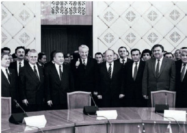
Ալմա-Աթայի հանդիպման մասնակիցները ԱՊՀ-ի ստեղծման մասին հայտարարությունից հեղու, 1991 թ., դեկտեմբեր

և դադարեցրին ուժային գործողությունները: 1991թ. օգոստոսի 21-ին Մոսկվայում ժողովրդավարական ուժերին հաջողվեց Ռուսաստանի նախարար Բ. Ելցինի գլխավորությամբ ձևել խոշորությունը և ձերբակալել նրա կազմակերպիչներին (փոխնախագահ Գ. Յանան, վարչապետ Վ. Պավլով, պաշտպանության մինիստր Դ. Յազով և ուրիշներ): Խոշորության ձևումից հետո ԽՍՀՄ-ը փաստացի փլուզվեց: 1991թ. սեպտեմբերին բոլոր միութենական հանրապետությունները հայտարարեցին իրենց ինքնիշխանության և անկախության մասին, հրաժարվեցին ստորագրել միութենական նոր պայմանագիրը: 1991թ. աշնանը ԽՍՀՄ-ը փրկելու՝ Մ. Գորբաչովի վերջին՝ հուսահատ փորձը ևս անհաջողության մատնվեց: