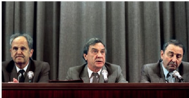
Արտակարգ դրության պետական կոմիտեի հայտարարությունը իշխանությունն իր ձեռքը վերցնելու մասին, 1991 թ., օգոստոսի 19