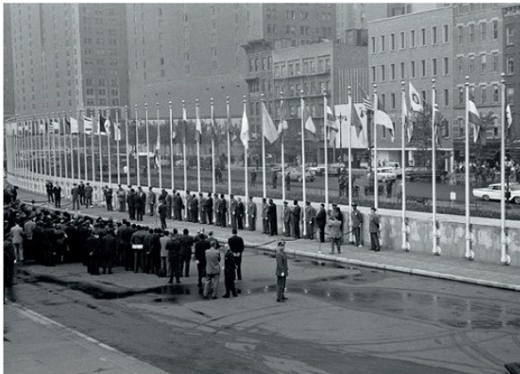
Անկախացած աֆրիկյան երկրների դրոշների բարձրացումը ՄԱԿ-ի շենքի դիմաց, 1960 թ., սեպտեմբերի 30

Ազգային-ազատագրական պայքարը Կենտրոնական և Հարավային Աֆրիկայում ծավալվեց համեմատաբար ավելի ուշ՝ XX դարի 50-ական թվականների երկրորդ կեսին և մեծ թափ ստացավ 60-ական թվականներին: Աֆրիկյան երկրների համար առավել արդյունավետ եղավ 1960 թվականը,