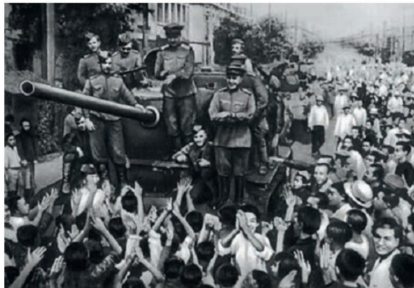
Խորհրդային զորքերի դիմապորտումը Չինաստանում

ունեցավ շատ կարևոր քաղաքական հետևանքներ այդ երկրների ճակատագրում: Պատերազմի ավարտից հետո խորհրդային զորքերն անմիջապես դուրս չեկան գրաված երկրներից՝ իրականացնելով քաղաքական խնդիրներ: Խոսքը Ալբանիայի, Բուլղարիայի, Արևելյան Գերմանիայի, Լեհաստանի, Հարավսլավիայի, Հունգարիայի, Չեխոսլովակիայի և Ռումինիայի մասին է: