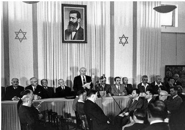
Իսրայելի անկախության հռչակումը, 1948 թ., մայիս

այլն, ընտրեցին զարգացման սոցիալիստական կողմնորոշման ուղին: Զգալի թվով երկրներ նախապատվությունը տվեցին զարգացման արևմտյան, այսինքն կապիտալիստական ուղուն: Արաբական երկրների մի խումբ էլ, մերժելով վերոնշյալ երկու ուղղություններն էլ, նախապատվությունը տվեց ավանդական և իսլամական ուղուն, անգամ շրջանառության մեջ դրվեց «իսլամական սոցիալիզմ» եզրույթը: Այդ ուղղությունը գլխավորում էր Սաուդյան Արաբիան, որի Սահմանադրությունը