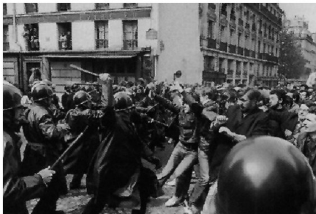
Տեսարան երիտասարդների խռովությունից, Փարիզ, 1968 թ.

1981թ. մայիսին Ֆրանսիայում տեղի ունեցած նախագահական ընտրություններն ավարտվեցին սոցիալիստ Միտերանի հաղթանակով: Միտերանը մեծ ուշադրություն դարձրեց Ֆրանսիայի սոցիալ-տնտեսական խնդիրներին: Նա կողմնակից էր տնտեսության մեջ պետության կարգավորիչ դերի մեծացմանը, ազգայնացրեց կարևոր արդյունաբերական ձյուղերը, մասնավոր բանկերը, ստեղծվեցին նոր աշխատատեղեր, կրճատվեց գործազրկությունը, կայունացվեց ներքաղա-