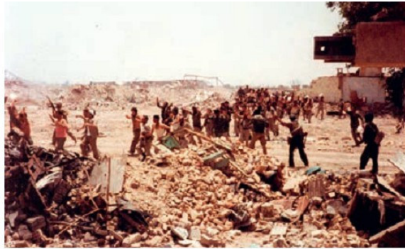
Տեսարան Իրան-իրաքյան պատերազմից, 1980-1988 թթ.

2013թ. Իրանում տեղի ունեցան նախագահական ընտրություններ, և Իրանի պրեզիդենտ ընտրվեց Ռուհանին: Նրա պաշտոնի ստանձնման արարողությանը ներկա էր նաև ՀՀ նախագահ Սերժ Սարգսյանը: