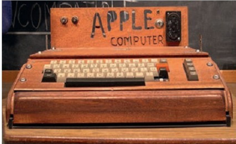
Առաջին կենցաղային համակարգիչներից մեկը «Apple», ԱՄՆ, 1970-ական թվականներ

XX դարի երկրորդ կեսին և XXI դարի սկզբին, երբ արդյունաբերական հասարակությանը փոխարինեց հետարդյունաբերական հասարակությունը, մշակույթը և գիտությունը թևակոխեցին զարգացման նոր փուլ: Դրանք դարձան հետարդյունաբերական հասարակության պահանջները բավարարող մշակույթ և գիտություն: