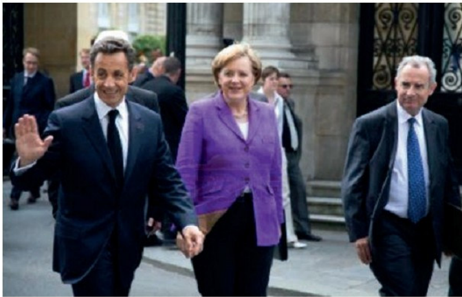
Ֆրանսիայի նախագահ Ն. Մարկոզին և Գերմանիայի կանցլեր Ա. Մերքելը

խարհի ամենազարգացած և տնտեսապես հզոր պետություններից մեկը: