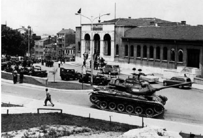
Տեսարան Գյուրսեղի հեղաշրջումից հետո, Թուրքիա, 1960 թ. մայիս

իրադրությունը Թուրքիայում: Սպառնալի չափեր ընդունեց ահաբեկչությունը: Անհանգիստ էր վիճակը նաև քրդաբնակ վայրերում, որտեղ գինված բախումները դարձել էին սովորական երևույթ: