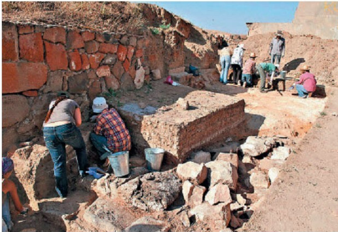
Պեղումներ Էրեբունի ամրոցում

Չնայած հիմնարար գիտությունների բուռն զարգացմանը, հասարակական և հումանիտար գիտությունները նույնպես