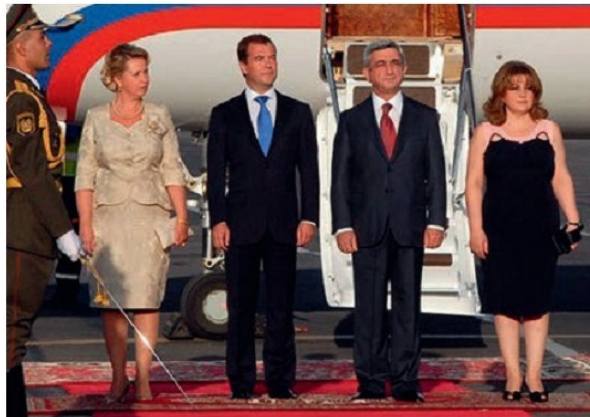
Ռուսաստանի նախագահ Վ. Մեդվեդևը Հայաստանում