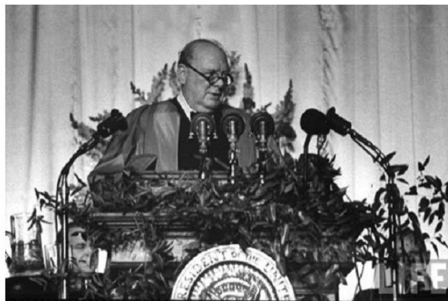
Չերչիլի ելույթը Ֆուլտոնում, ԱՄՆ, 5 մարտի 1946 թ.

ԱՄՆ-ի կառավարող շրջաններն առաջ քաշեցին «կոմունիզմի զսպման» կարգախոսը: Նրանց կարծիքով դրան կարելի էր հասնել, եթե ԽՍՀՄ-ի հանդեպ իրականացվեր «ուժի դիր-