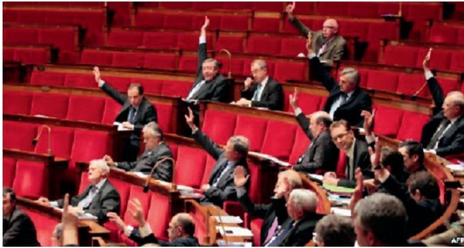
Հայոց ցեղասպանությանը նվիրված քննարկում Ֆրանսիայի Ազգային ժողովում