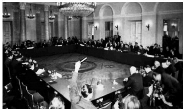
Վարշավայի պայմանագրի կազմակերպության ստեղծումը, 1955 թ.