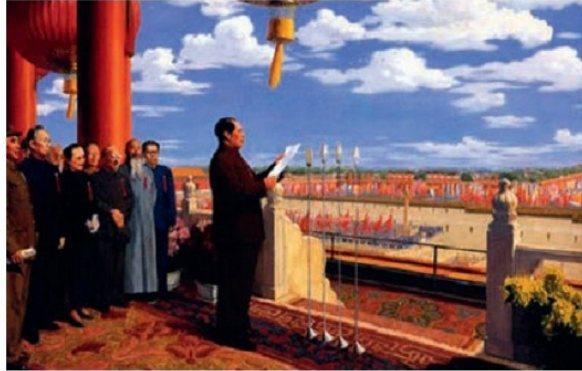
Չինական Ժողովրդական Հանրապետության հռչակումը, Պեկին, 1949 թ., հոկտեմբեր

Սկսվեց հալածանքը ղեկավար գործիչների, այդ թվում՝ ՉԺՀ-ի նախագահ Լու Շաոցիի, կոմունիստական կուսակցության գլխավոր քարտուղար Դեն Սյաոպինի և շատ ուրիշների դեմ: Երկրում առաջացավ խառնաշփոթ, որը շարունակվեց ընդհուպ մինչև