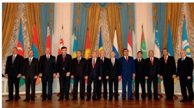
ԱՊՀ-ի երկրների ղեկավարների հանդիպում