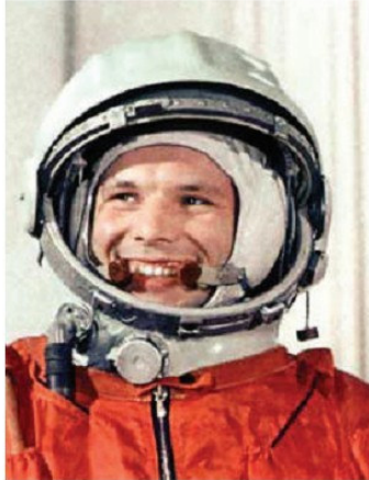
Յորի Գասպարին (1934–1968 թթ.)

հանրապետությունների իրավունքները, բարելավվեցին խորհուրդների աշխատանքները, բարձրացավ արհմիությունների դերը տնտեսական և մշակութային կյանքում: Արդյունաբերական ճյուղային կառավարումը փոխարինվեց տարածքային կառավարմամբ, ստեղծվեցին ժողտնտեսության տարածքային խորհուրդներ: Զարգացում ապրեց արդյունաբերությունը, ստեղծվեցին արդյունաբերական նոր կենտրոններ, կառուցվեցին շուրջ 6 հազար խոշոր արդյունաբերական ձեռնարկություններ: Արագացավ գիտատեխնիկական առաջընթացը: 1957թ. հոկտեմբերին տիեզերք արձակվեց աշխարհում առաջին արհեստական արբանյակը: 1961թ. ապրիլի 12-ին առաջինը Յու. Գասպարինը բացեց տիեզերք տանող մայրուղին: Դրական տեղաշարժեր կատարվեցին գյուղատնտեսության ոլորտում: Յուրացվեց 42 մլն հա խամ ու խոպան հող, ավելացավ գյուղատնտեսական տեխնիկայի արտադրությունը: Գյուղատնտեսության մեջ սկսեց լայնորեն կիրառվել էլեկտրաէներգիան: Բարելավվեցին գյուղացիների կյանքի պայմանները, փոխվեցին նրանց վարձատրության ձևերը: Առաջին անգամ գյուղացիությանը տրվեց անձնագիր, և սահմանվեց կենսաթոշակ: Վերելք ապրեց նաև մշակույթը: Երկրի հոգևոր կյանքում սկսվեց «ձնհալի» գործընթացը: Մեղմացան գաղափարական ճնշումները և գրաքննությունը: Մտավորականությունը ստացավ համեմատաբար ազատ ստեղծագործելու հնարավորություն: