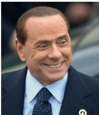
Միլվին Բերլուսկոնի (ծնվ. 1936 թ.)

Իտալիա: Իտալիան արդի աշխարհի զարգացած պետություններից մեկն է և որոշակի կշիռ ունի, մանավանդ եվրոպական գործերում: Նա ԵՄ-ի