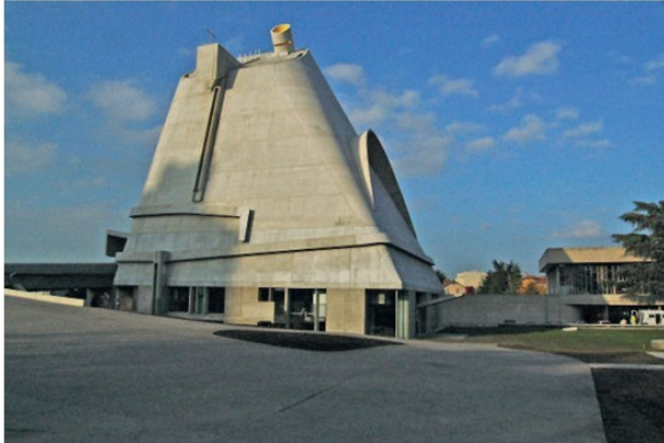
Եկեղեցի Սեն Պերիոս, ճարտարապետ Լ. Կորբյուզե

նամեկուսացման արդի մեթոդները և այլն: Ճարտարապետական ուրույն կենտրոններ են գետնուղիները և դրանց կայարանները՝ իրենց ներքին ճաշակավոր, գեղարվեստական հարդարանքներով: Լայն տարածում ստացավ երկնաքերների կառուցումը: Արդի ճարտարապետությունը հենվում է Լ. Կորբյուզեի, Վան դեր Ռոենի, Գրոպյիուսի, Ֆ.Ռայթի ու Կ. Հալբայանի տեսադրույթների և բազմամյա փորձառության վրա: