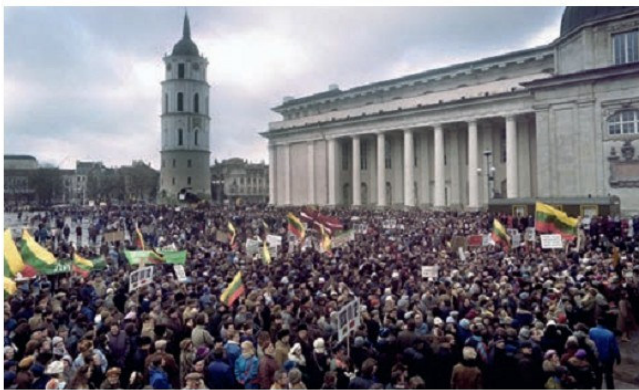
Զանգվածային ելույթ, Վիկյուս, 1990 թ.