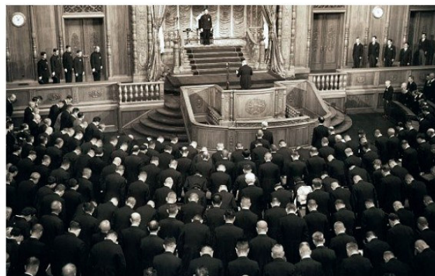
Ճապոնական Սահմանադրության ընդունումը, 1947թ.