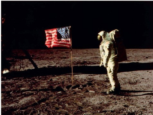
Ամերիկացի տիեզերագնաց Ն. Արմսթրոնգը Լուսնի վրա

Ներդրումները ստեղծման բնագավառում, իսկ ժողովրդավարությունը դարձավ մարդկային հասարակության զարգացման առաջադիմական միակ ուղին: